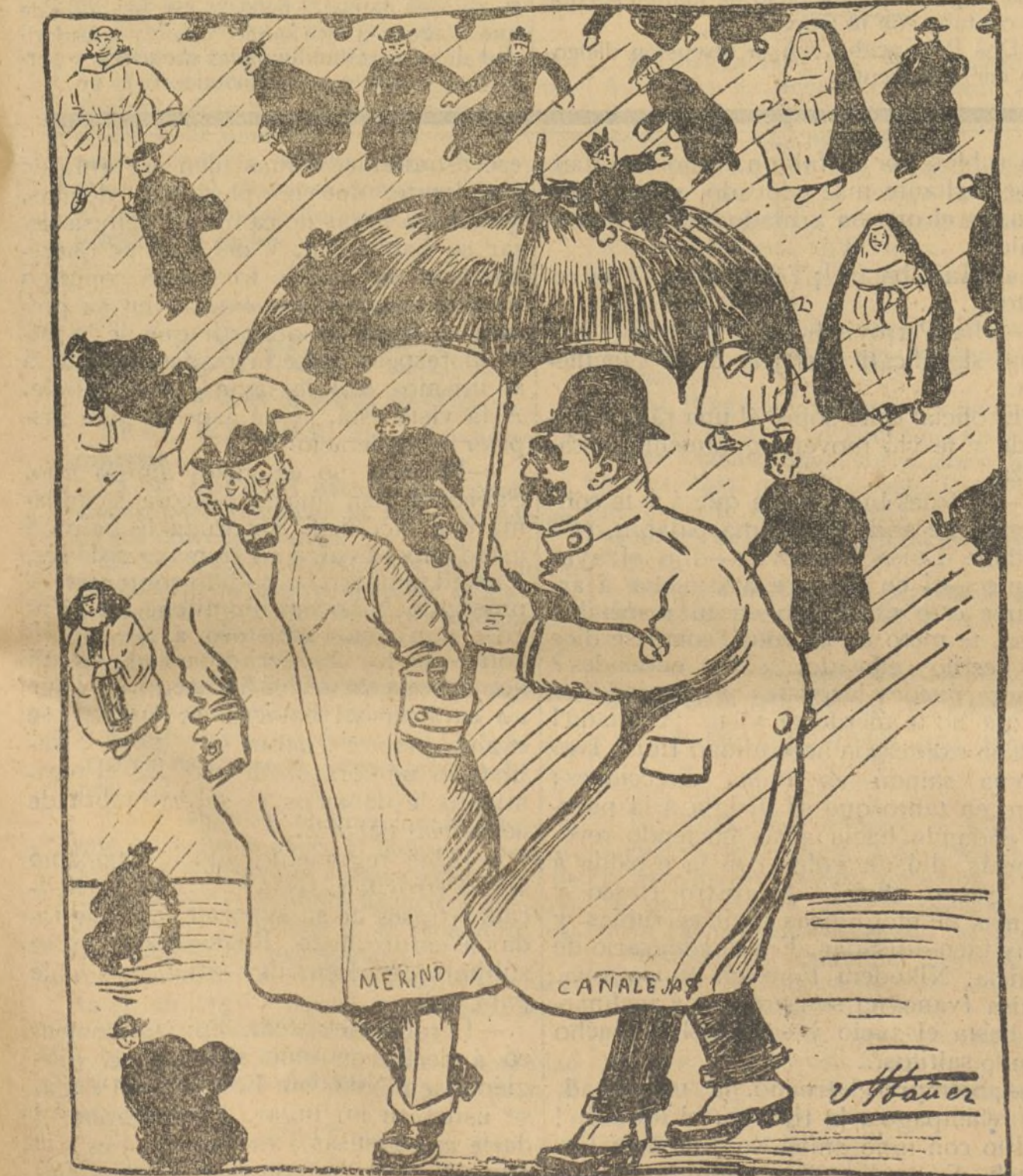
Merino.—¿Parece que no lleva trazas de escampar! Canalejas.—¡Y lo más grave es que caen de piel!