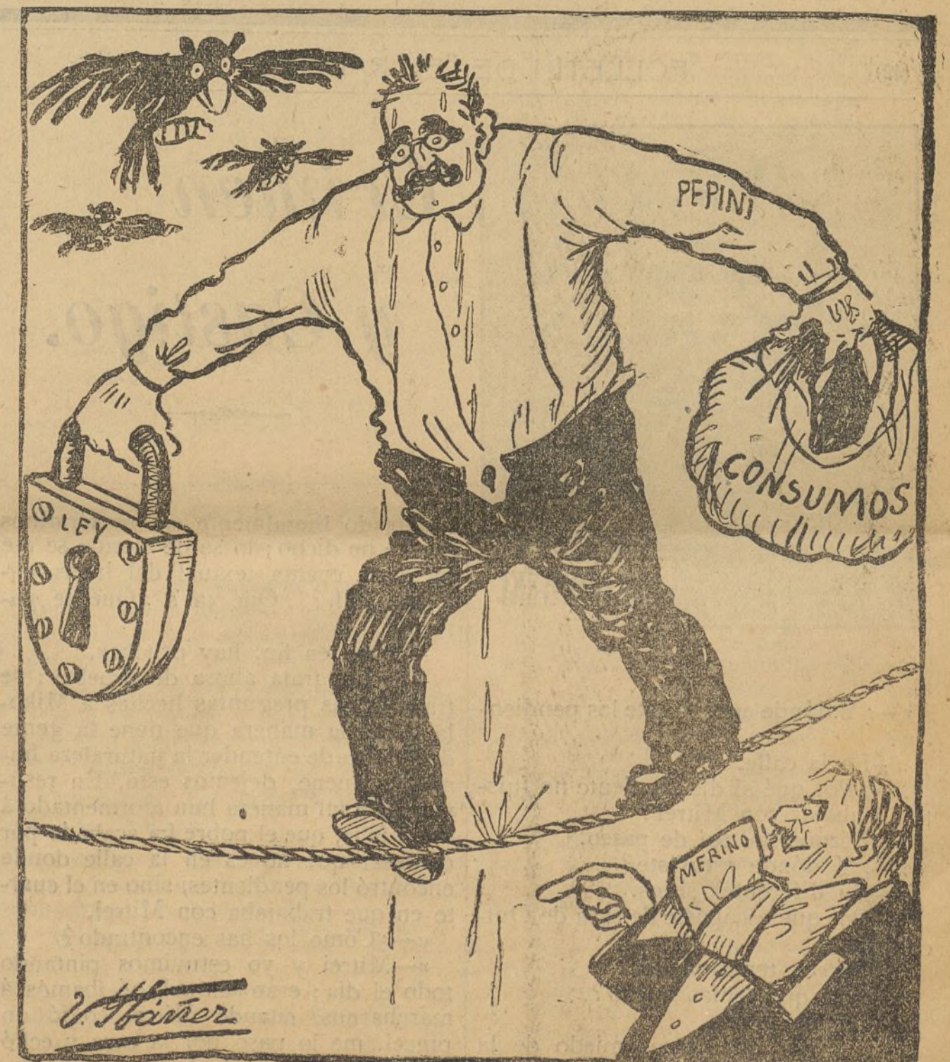
D. José.—Me parece que estos contrapesos me ayudarán a caer.