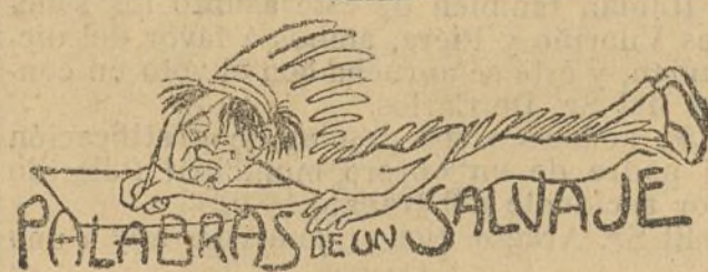
PALABRAS DE UN SALVAJE

Con este sistema pronto volverá a aparecer el déficit que Villaverde logró convertir en superávit, gracias a su energía y a la política prudente que siguió. No será el Sr. Cobdán quien menos habrá influido, con su desastrosa gestión financiera, a que no queden ni huellas de la obra realizada por aquel hacendista.