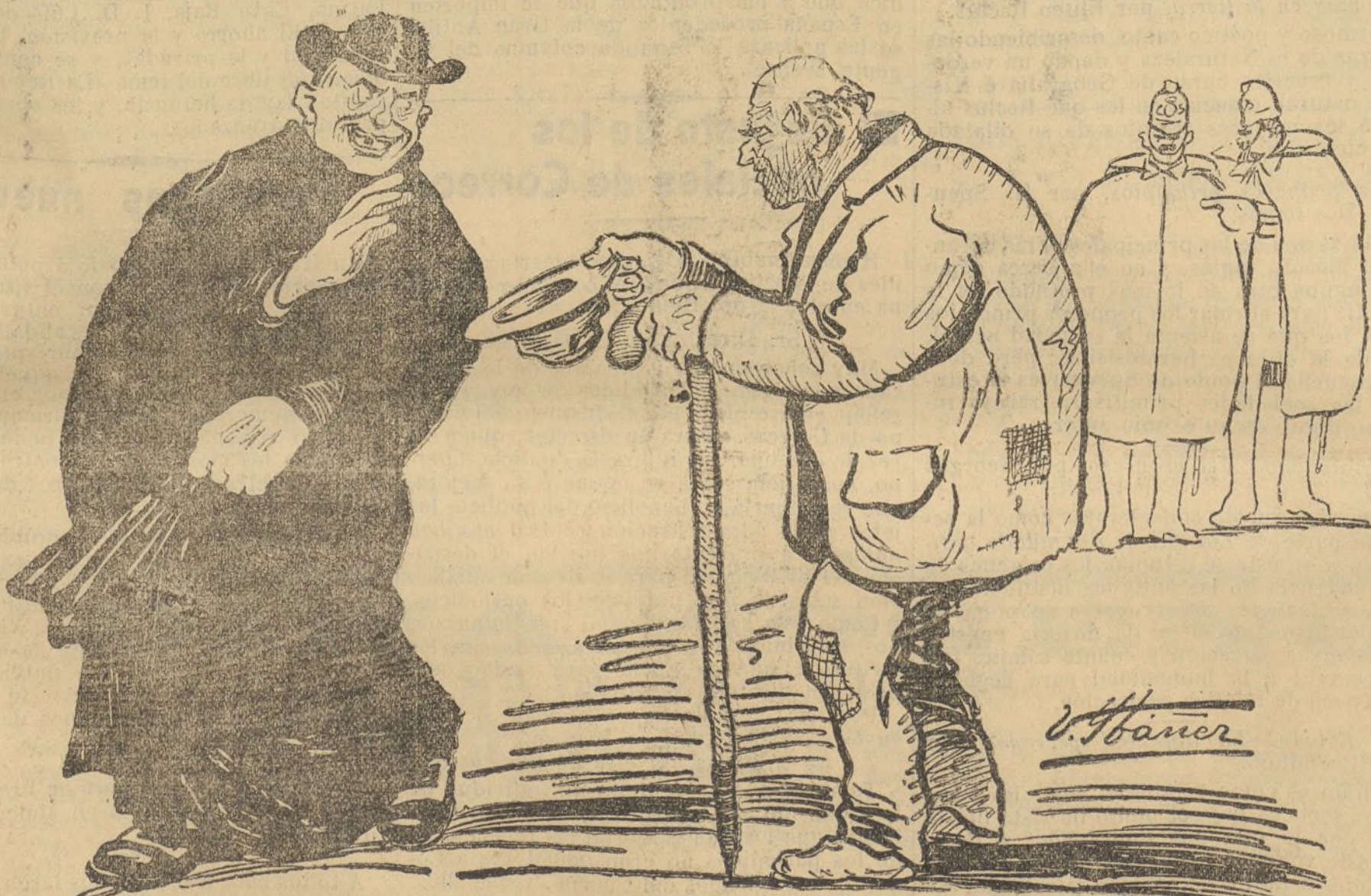
El cura.—Rece y Dios le ayudará... á bien morir,