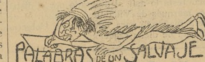
PALABRAS DE UN SALVAJE

Nos sabemos de memoria las habilidades ciervistas y los compadres de Canalejas con la minoría conservadora, para no sospechar de lo ocurrido ayer en el Congreso. ¿No fué el propio Sr. Cierva quien hizo imprimir, siendo ministro, un folleto con las actuaciones principales de este proceso? ¿No