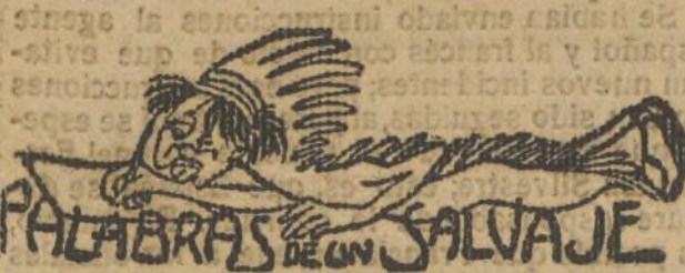
DESPUES DE LA

En dos días el autor dramático Enriquez Berz tein se ha batido dos veces. Primero con un redactor de Le Journal , y después con el hijo de Alfonso Daudet, Léon Daudet, el cual no ha rodado de su padre más que el apellido. En Léon Daudet se cumplió el refrán español que dice: «De padres listos, hijos tontos».