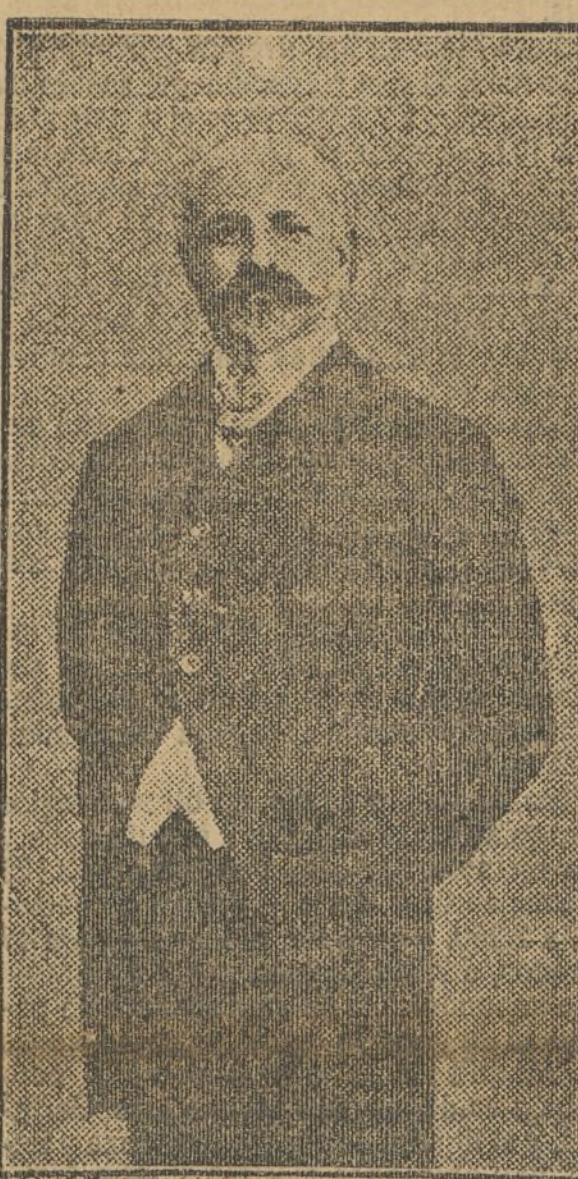
Francisco Ferrer Guardia