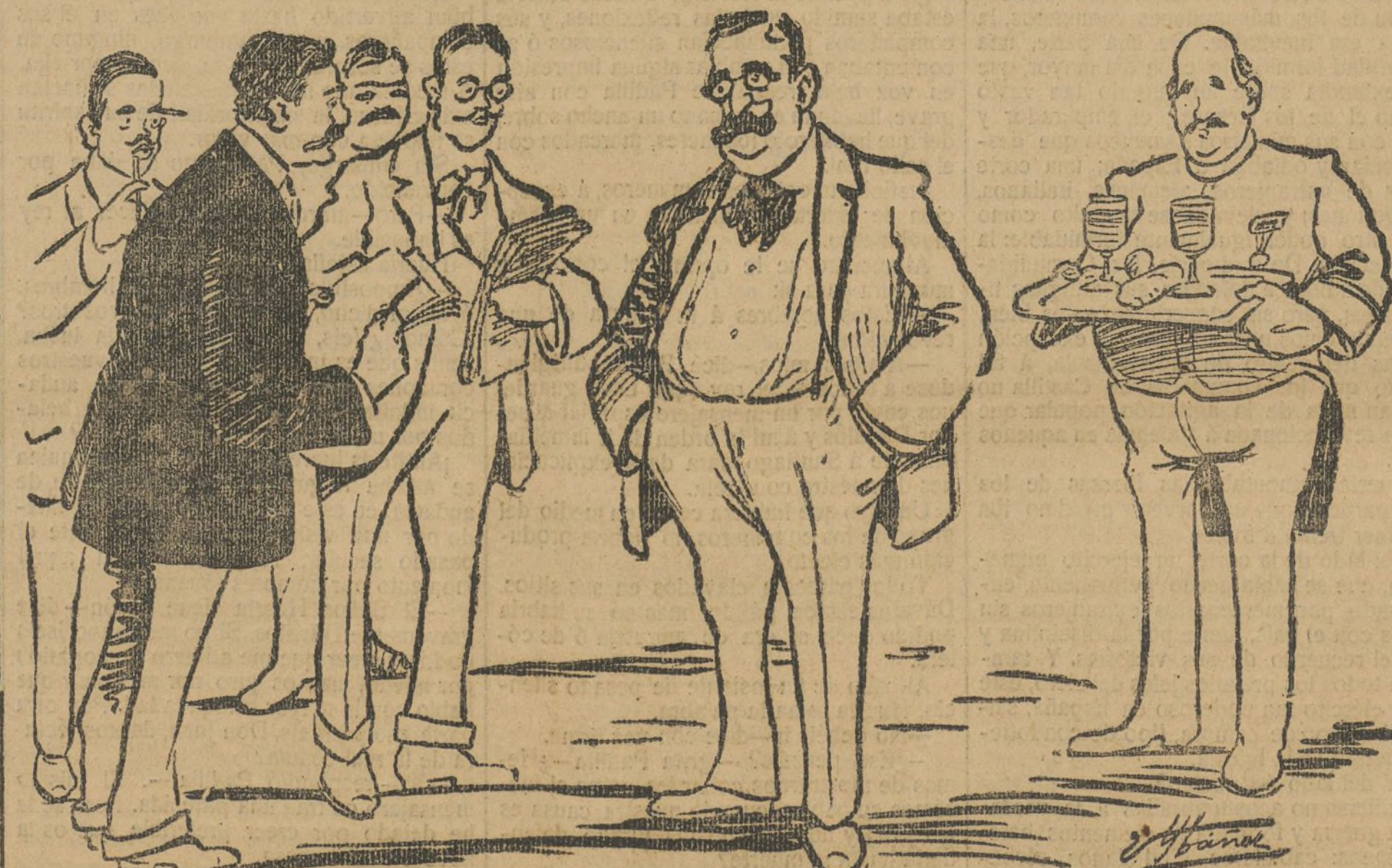
—Señores, acabaré de una frase confidencial: "Después de mí, ¡el diluvio!".