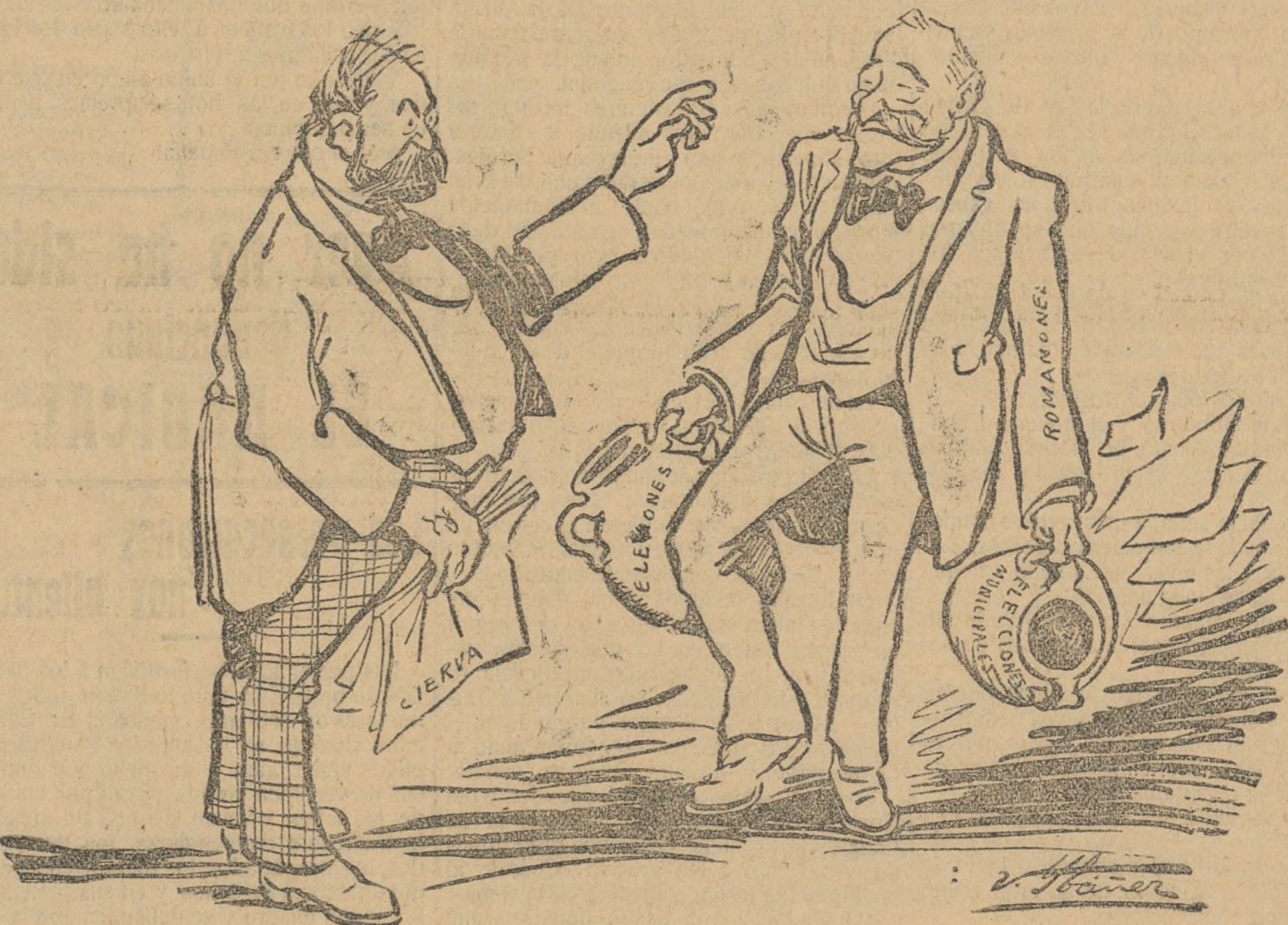
De estos pucheros saldrá nuestra admirable reforma administrativa.