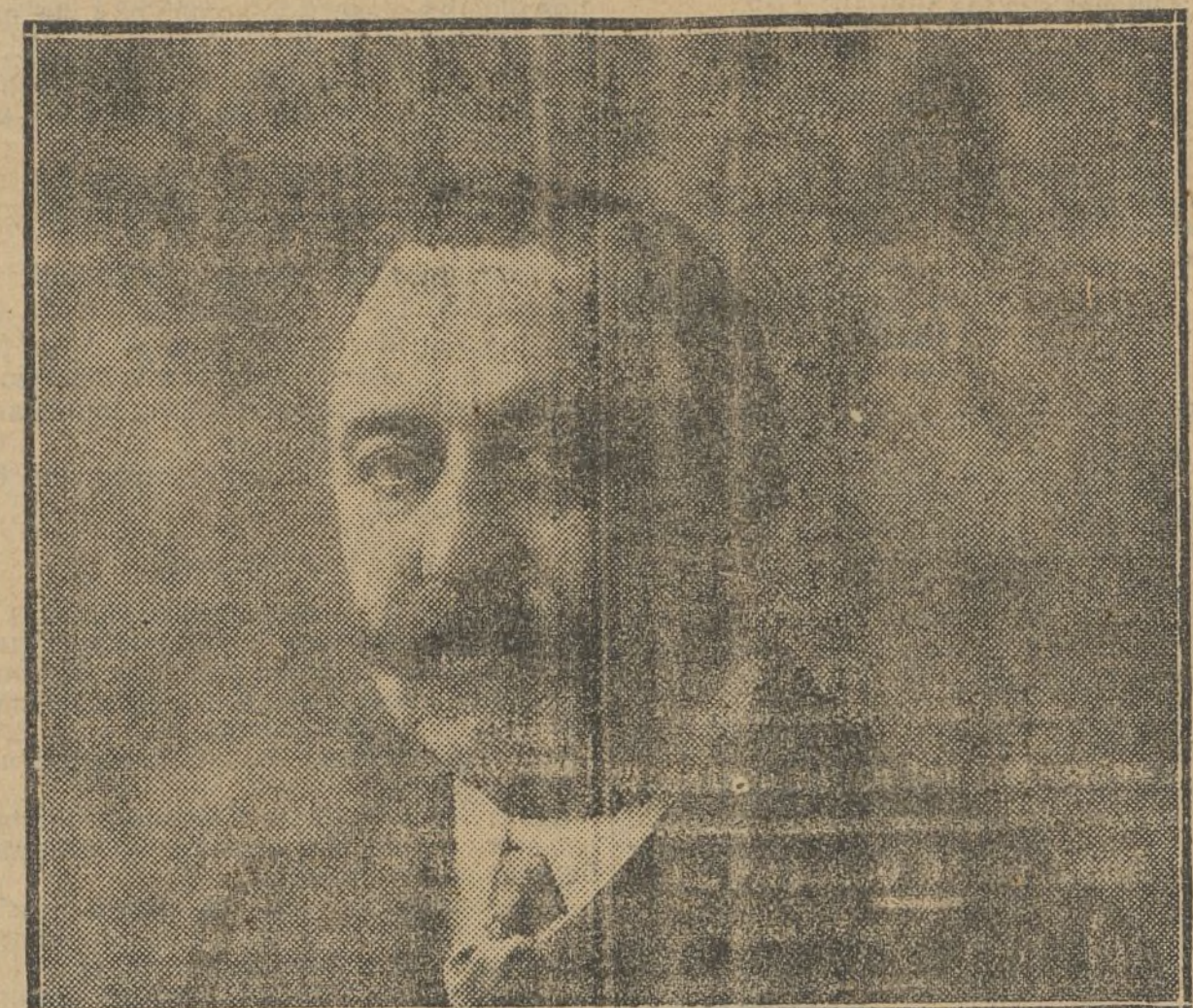
El ex diputado a Cortes D. Adolfo Beltrán.