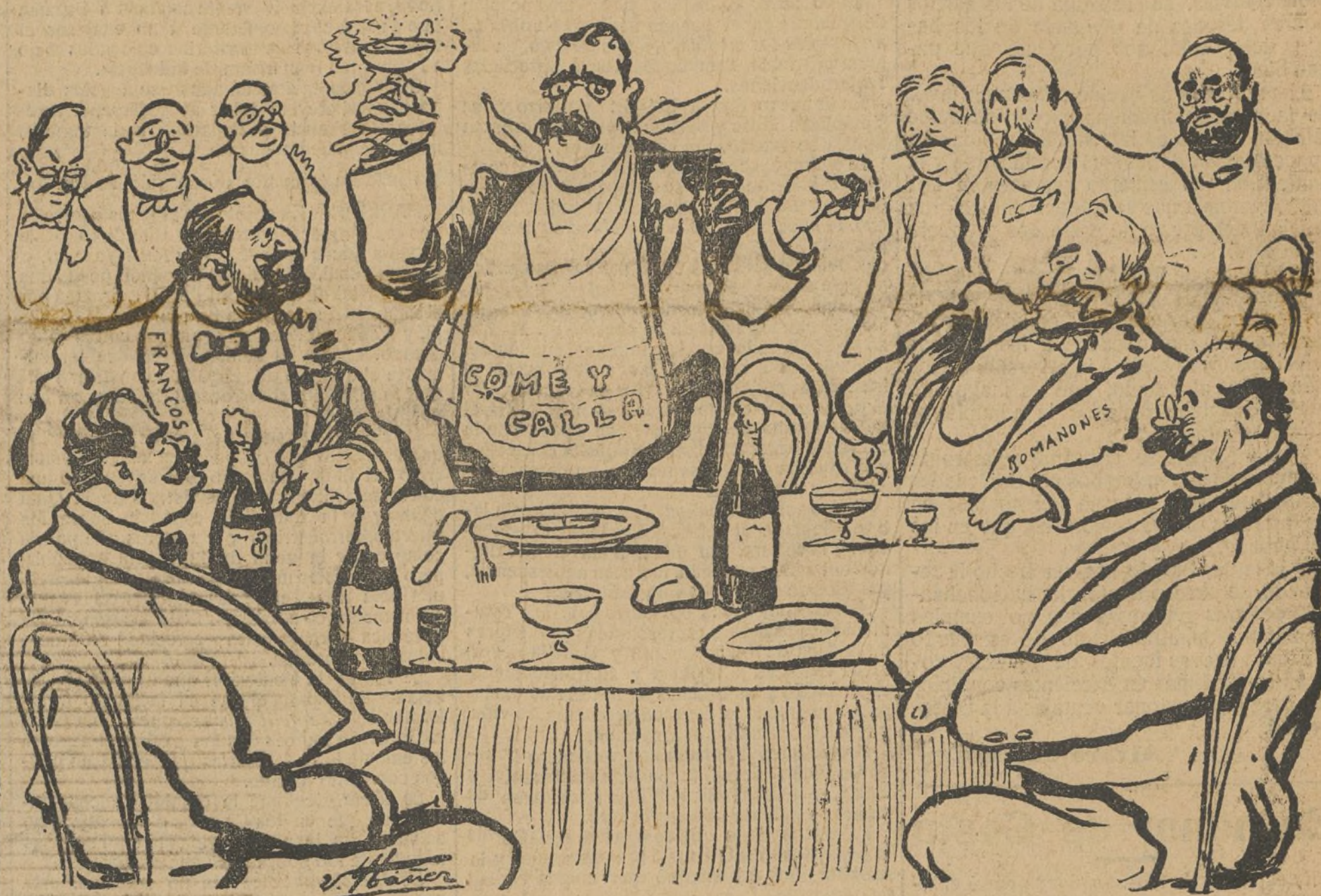
CANALEJAS. — ¡Ah, señores! y cuento también con el apoyo de doña Virtudes y demás familia.