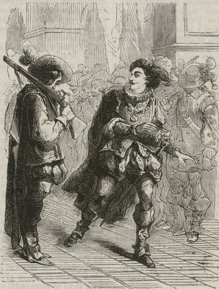
Entra en la sala de los guardias..... (Pág. 15.)

más atrevido. En derredor reinaba un silencio profundo; la imagen de la muerte se representaba por