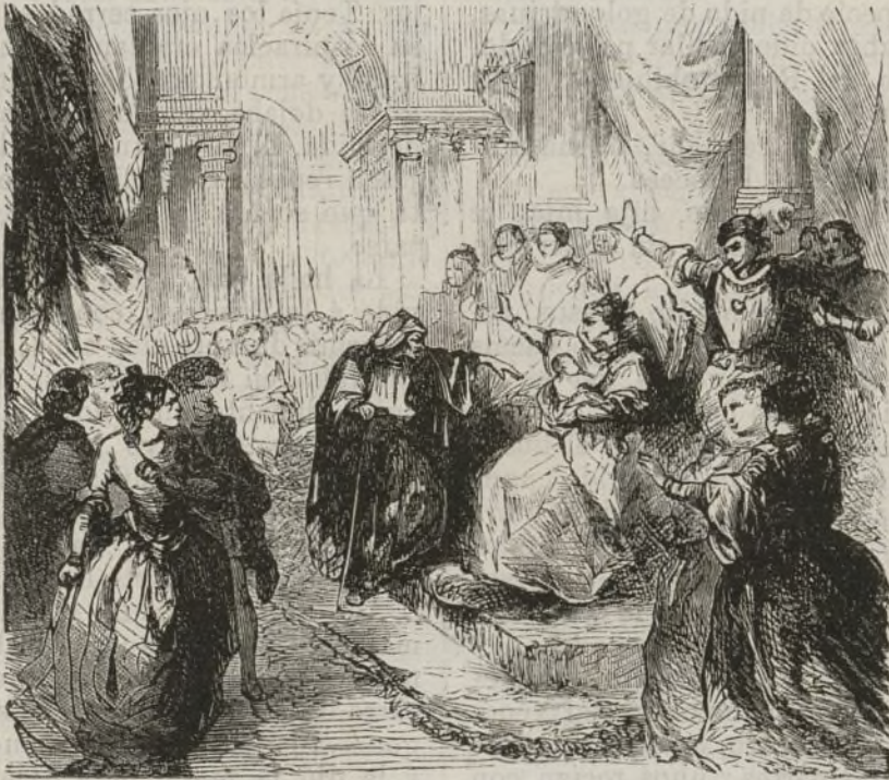
Quando llegó su turno á la hada vieja..... (Pág. 8.)

El padre quedó algo más tranquilo con estas palabras; pero á fin de evitar, en cuanto estuviese de su parte, la desgracia predicha por la vieja, mandó publicar un bando prohibiendo hilar con husos,