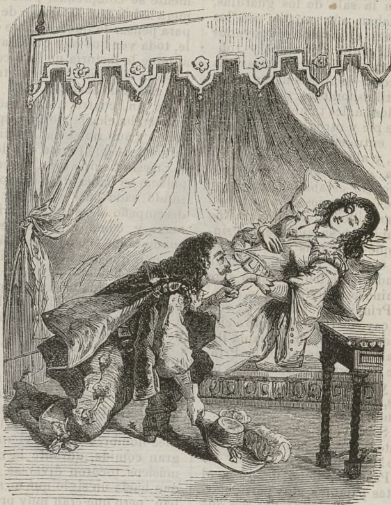
El Príncipe, admirado y suspensó.... (Pág. 13.)

El Príncipe se levantó al otro día | su tardanza. De vuelta al palacio muy de mañana para volver á la | le dijo al Rey que persiguiendo