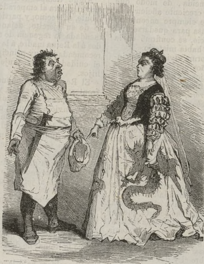
Mañana quiero almorzarme á Aurorita. (Pág. 15.)

manos y se fué derecho al corral, donde en lugar de la niña mató un corderillo, aderezándolo con una salsa tan bien hecha y sabrosa