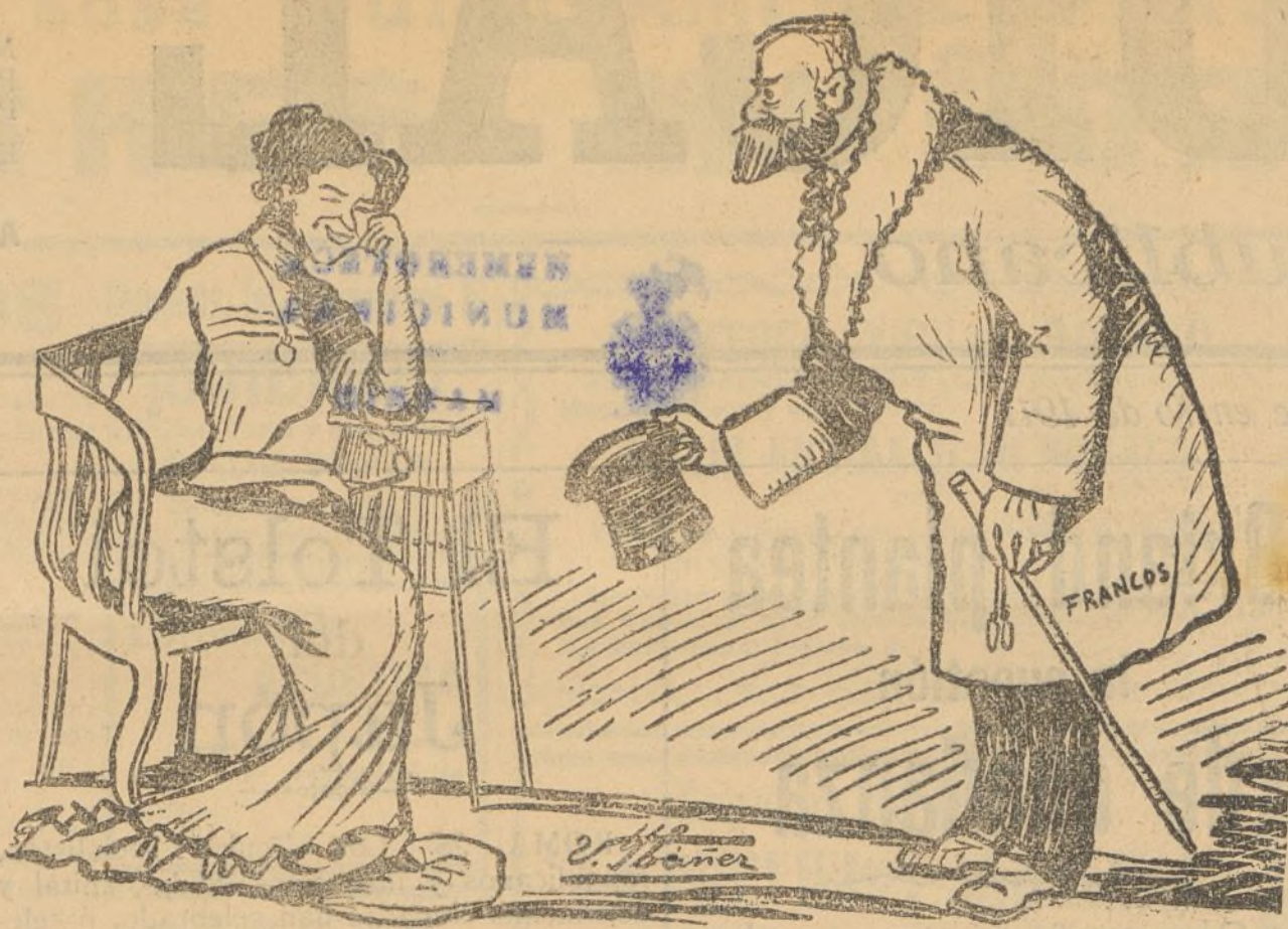
—¿Cómo va, querido alcalde?