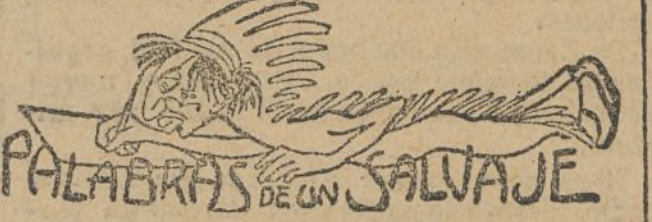
PALABRAS DE UN SALVAJE