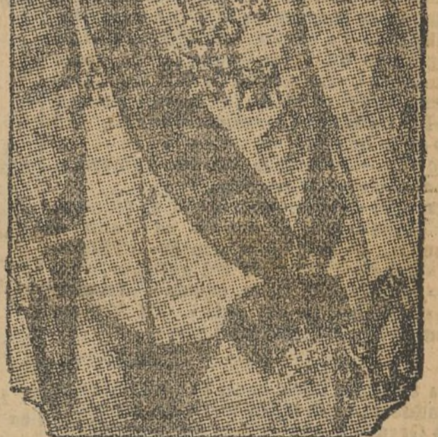
M. BREZIT el pintoresco presidente de la más pintoresca República del Curani.

Se trata, por lo visto, de una desgraciada histérica.