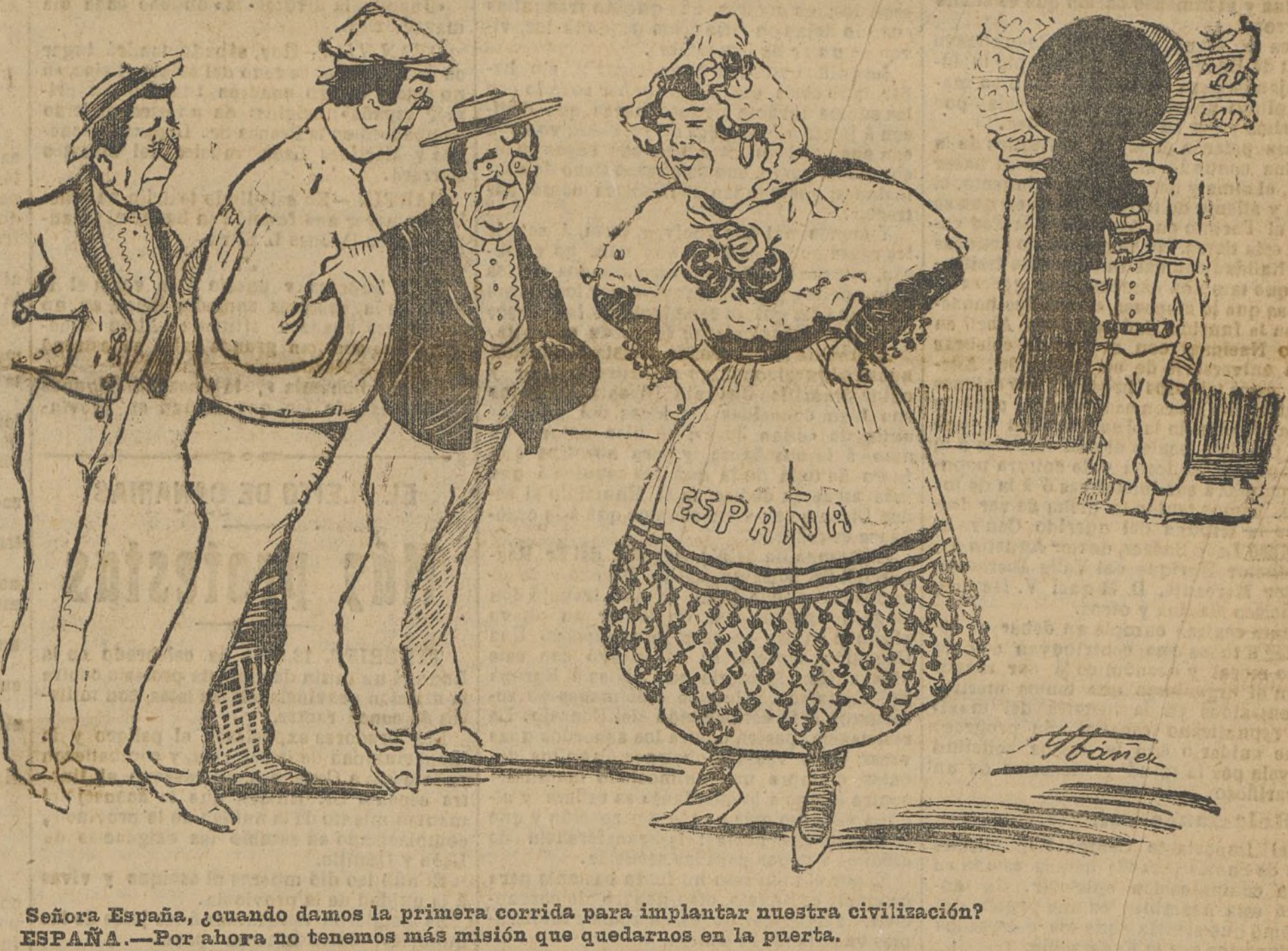
Señora España, cuando damos la primera corrida para implantar nuestra civilización? ESPAÑA.—Por ahora no tenemos más misión que quedarnos en la puerta.