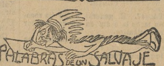
Palabras de don Salvaje

ZARAGOZA, 17. La Asociación de labradores ha obsequiado con un té a los congresistas de agricultura. El delegado francés pronunció un breve discurso, dando las gracias por el obsequio y elogiando a Aragón. Los congresistas presenciaron después la fiesta de la jota. Mañana realizará una excursión al pantano de la Peña. Ha llegado una peregrinación católica de Valencia.