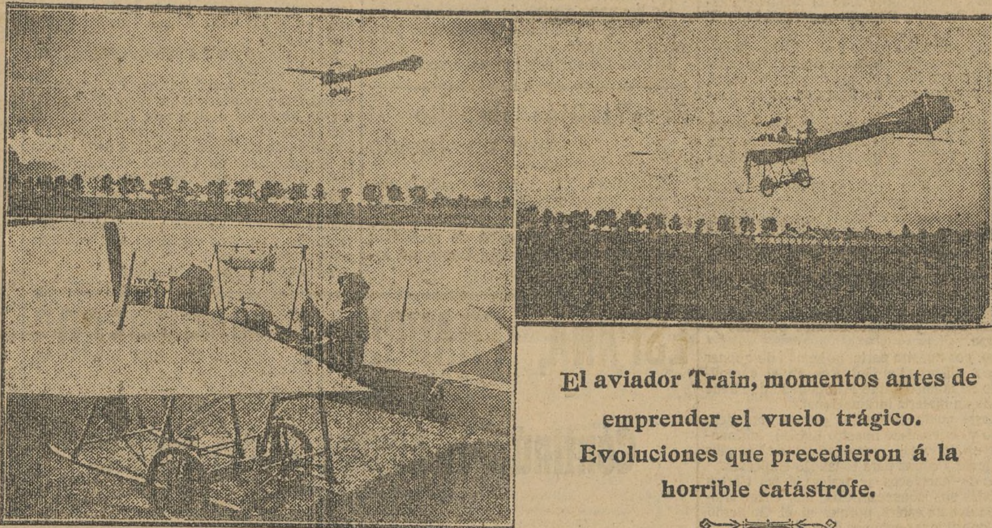
El aviator Train, momentos antes de emprender el vuelo trágico. Evoluciones que precedieron a la horrible catástrofe.