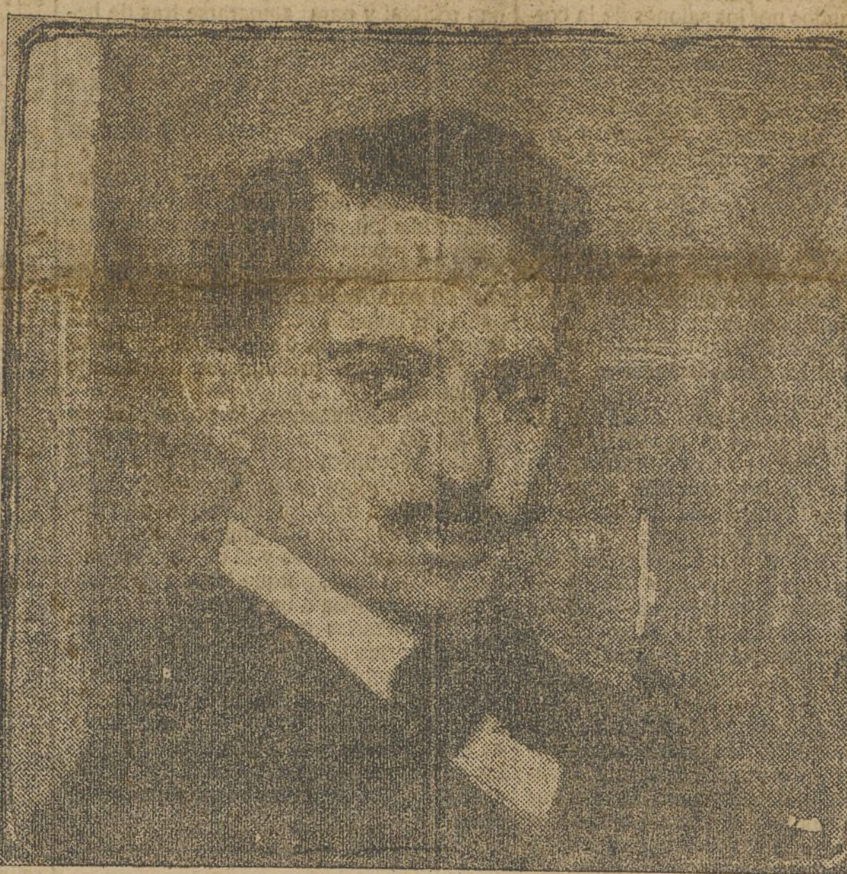
Anselmo Miguel Nieto.—Auto-retrato.