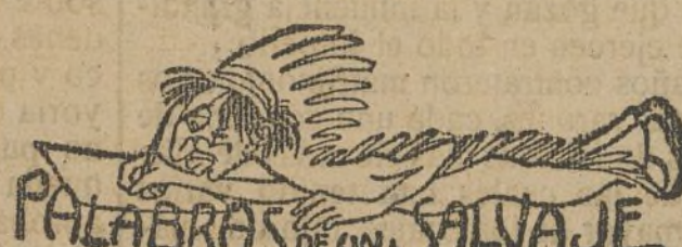
PALABRAS DE UN SALVAJE

«De suerte que los demás partidos, todos los que no profesan la legalidad, viven por un consentimiento de criterio que es verdadera ampliación del texto constitucional al amparo