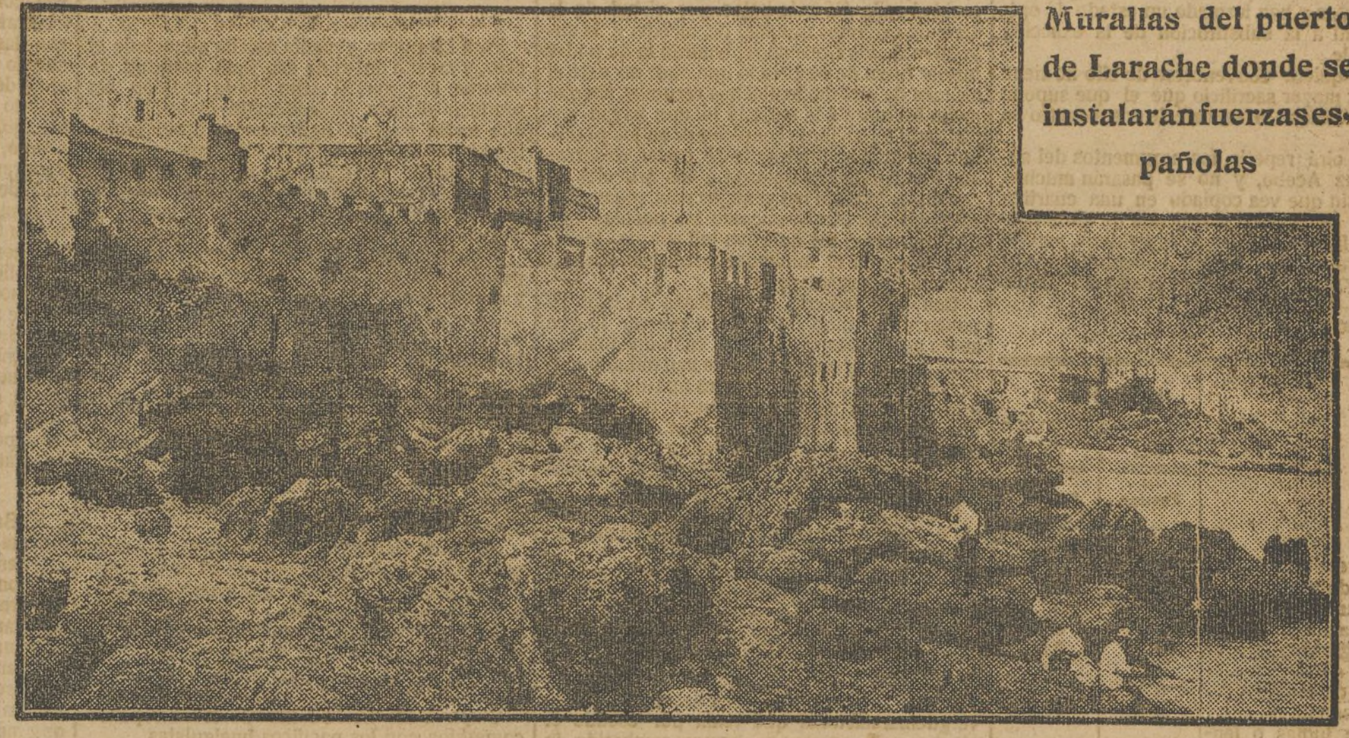
Murallas del puerto de Larache donde se instalarán fuerzas españolas.