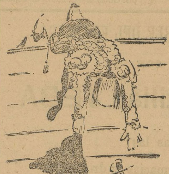
¡Es mucho Gallo, y muy malo, Sr. Mosquerla!

Sigue pinchando, y yo me marché para no seguir viendo a este torero.