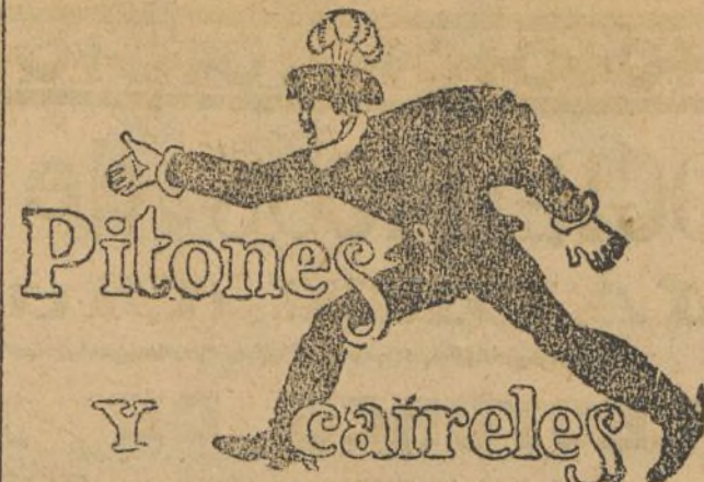
Pitones y catreles

Por la Comisión, Domingo Fernández Galán.