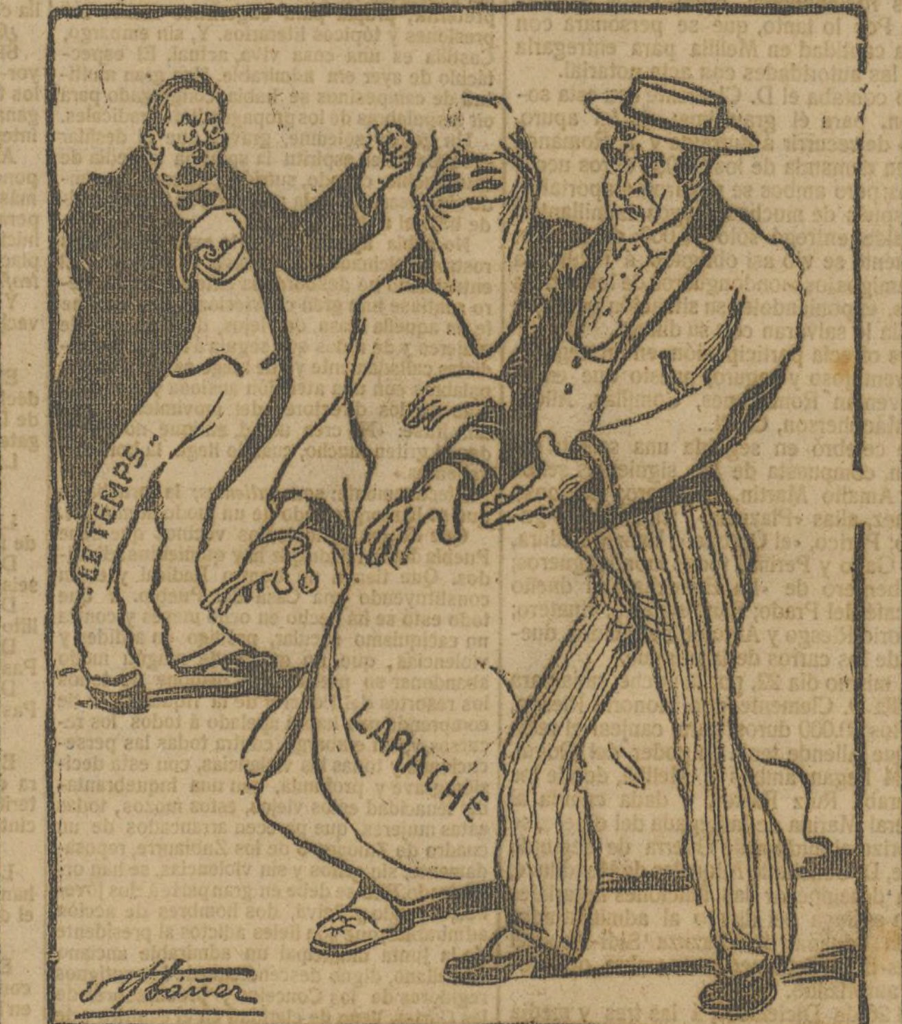
EL ESPAÑOL.—A mal «Tiempo», buena cara.