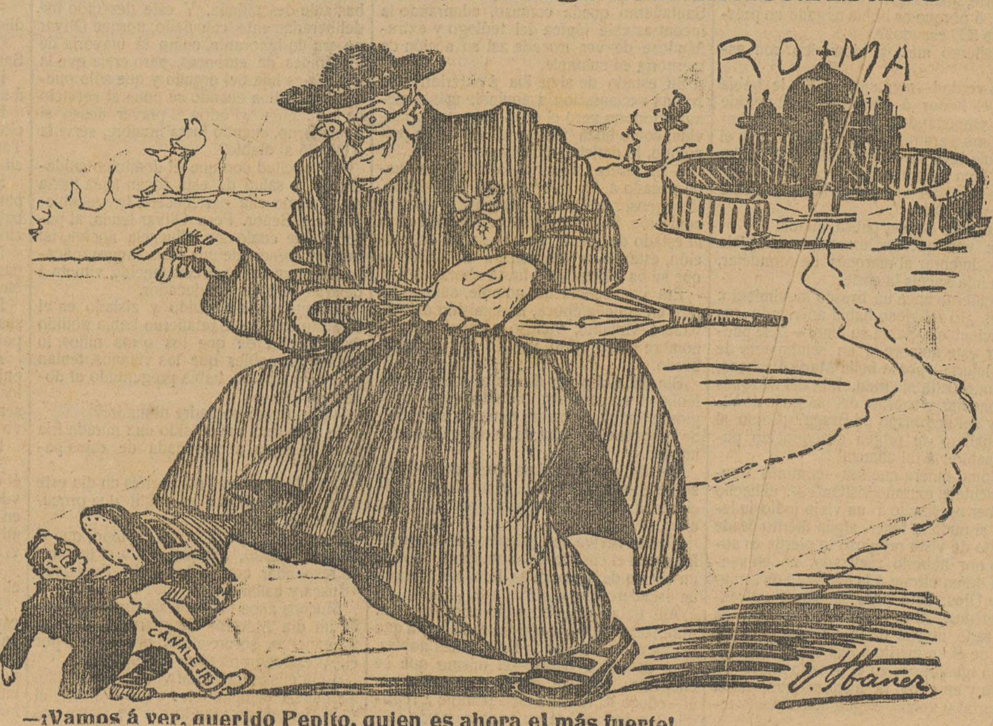
—¡Vamos a ver, querido Penito, quien es ahora el más fuerte!