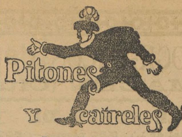
La corrida de Ríoseco.

El RADICAL les envía también su enhorabuena, y no duda que su pensamiento alcanzará el triunfo que desean, dado el entusiasmo que reina entre los queridos amigos y correligionarios de ese distrito, residencia oficial de la Monarquía.