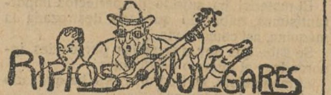
¡LAS COSAS, CLARAS!