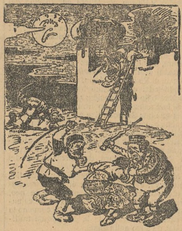
Francia destroza a Marruecos; los yanquis y los rusos a Persia; los italianos a los árabes.