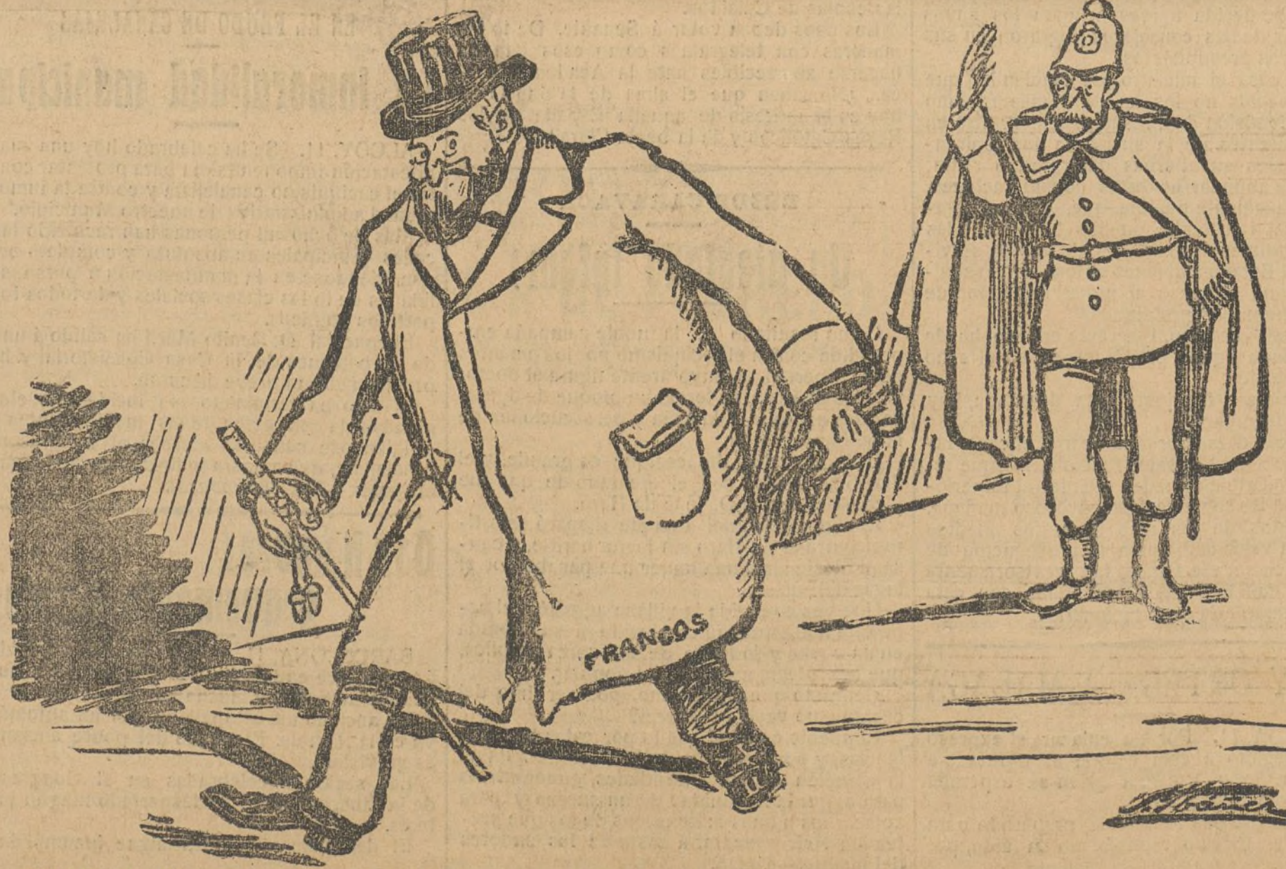
Caló el chapeo—recogió la vara—miró al soslayo—fuese y no pasó nada.