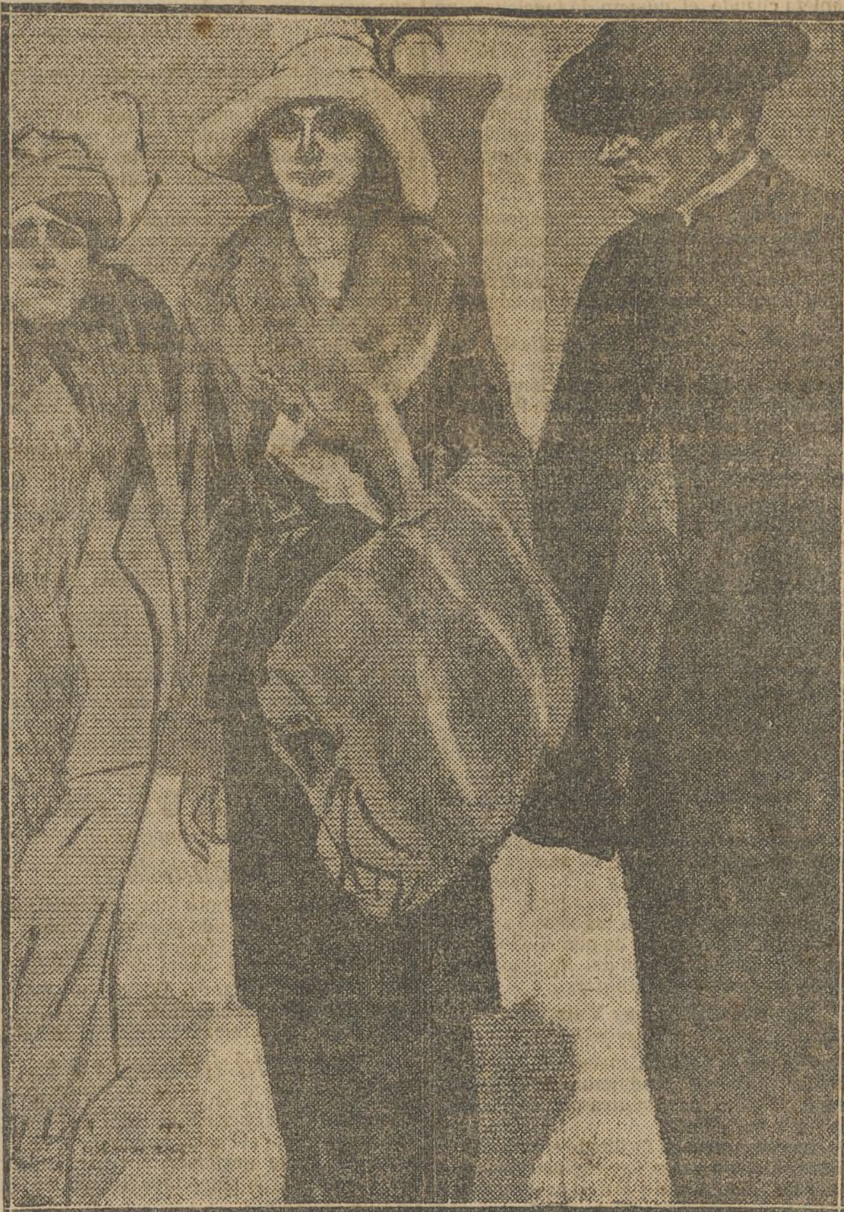
—Viendo estas bellezas modernas, yo también me siento modernista. (De 'Simplicissimus'.)