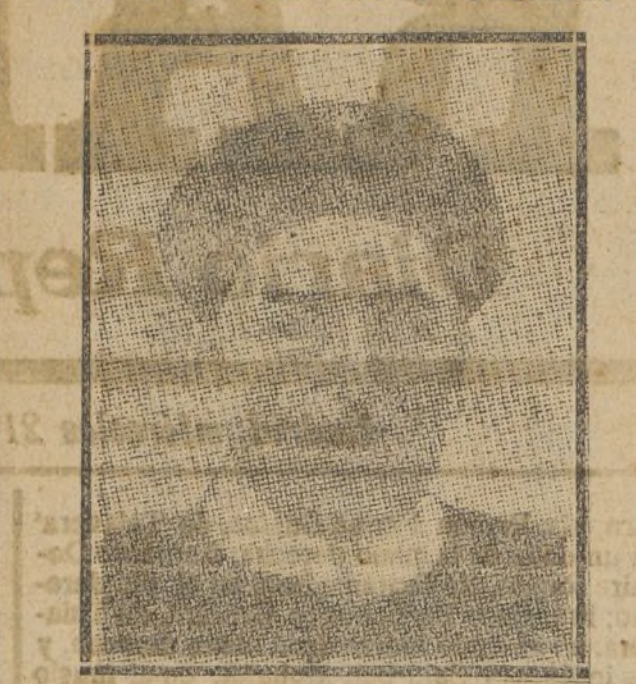
YUAN SHI KAI

El nuevo Gobierno republicano de Pekín ha dirigido al todos los representantes de Europa el siguiente despacho: