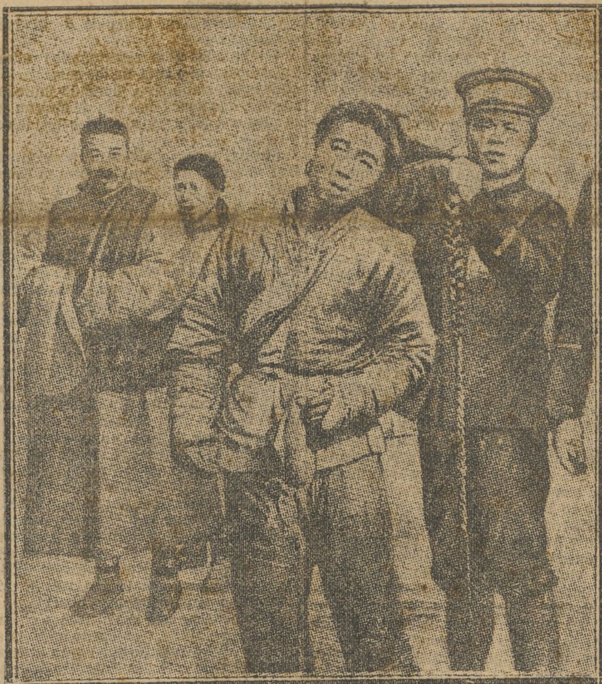
Los republicanos de China son inexorables contra las coletas. Destruyen la coleta para destruir la tradición.