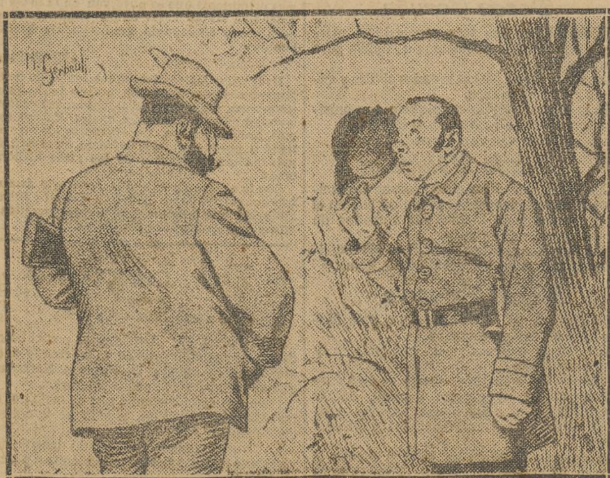
—¿Debo poner en la lista de las piezas cobradas, al guarda que acaba de matar el señor conde?