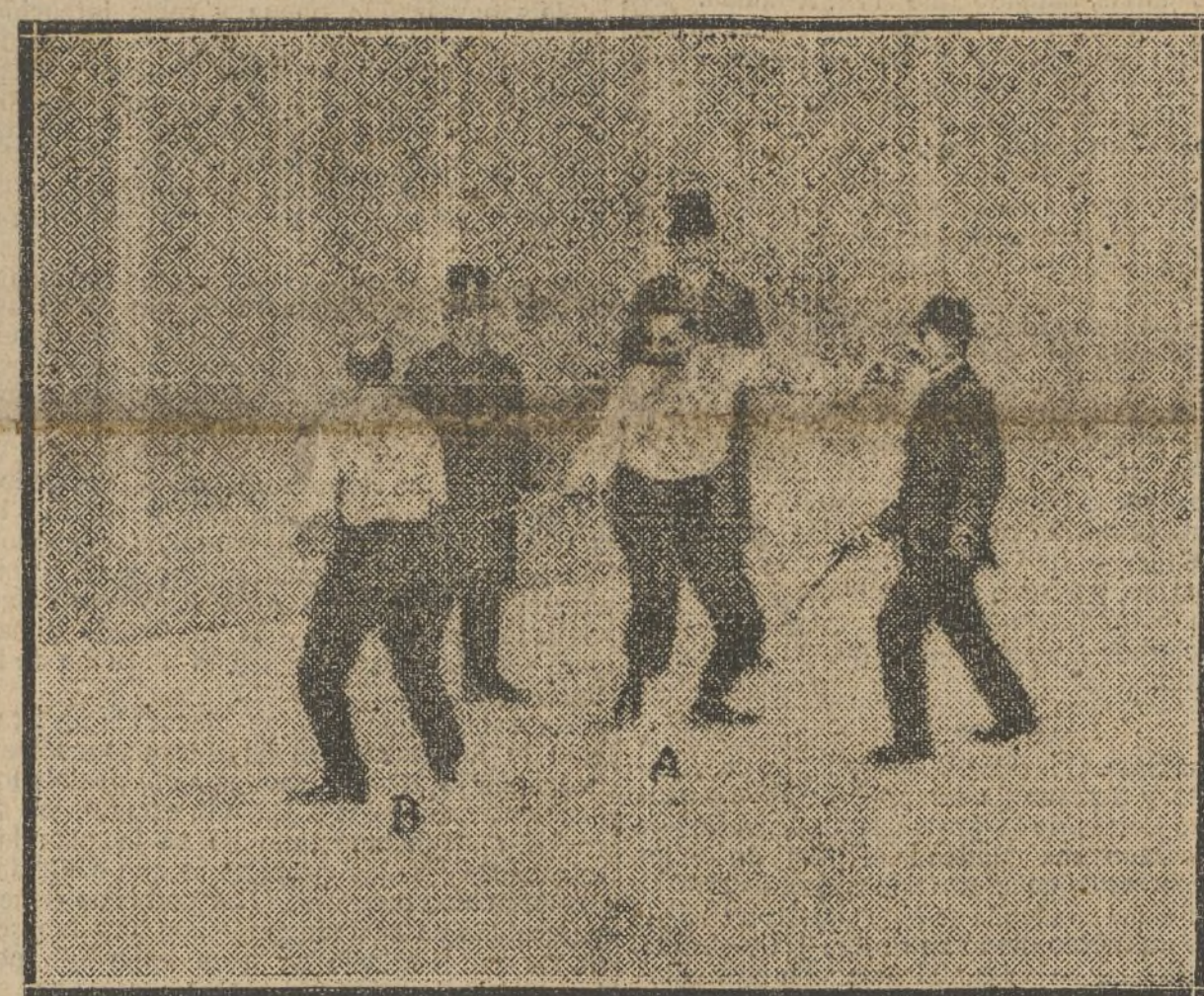
A Paul de Cassagnac.—B Charles Maurras.

PARIS, 28. Ayer se celebró el duelo entre M. Charles Maurras, redactor de L'Action Française , y M. Paul de Cassagnac, codirector de L'Autorité , que había despertado vivo interés por su extrema gravedad.