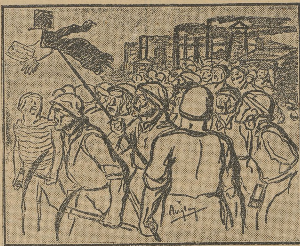
La revancha de los mineros ingleses, según la «Guerre Sociale».

GIBRALTAR, 6. Procedente de París ha llegado la Embajada marroquí, que, presidida por El Mokri, se hallaba en aquella capital, embarcando seguidamente para Tánger.