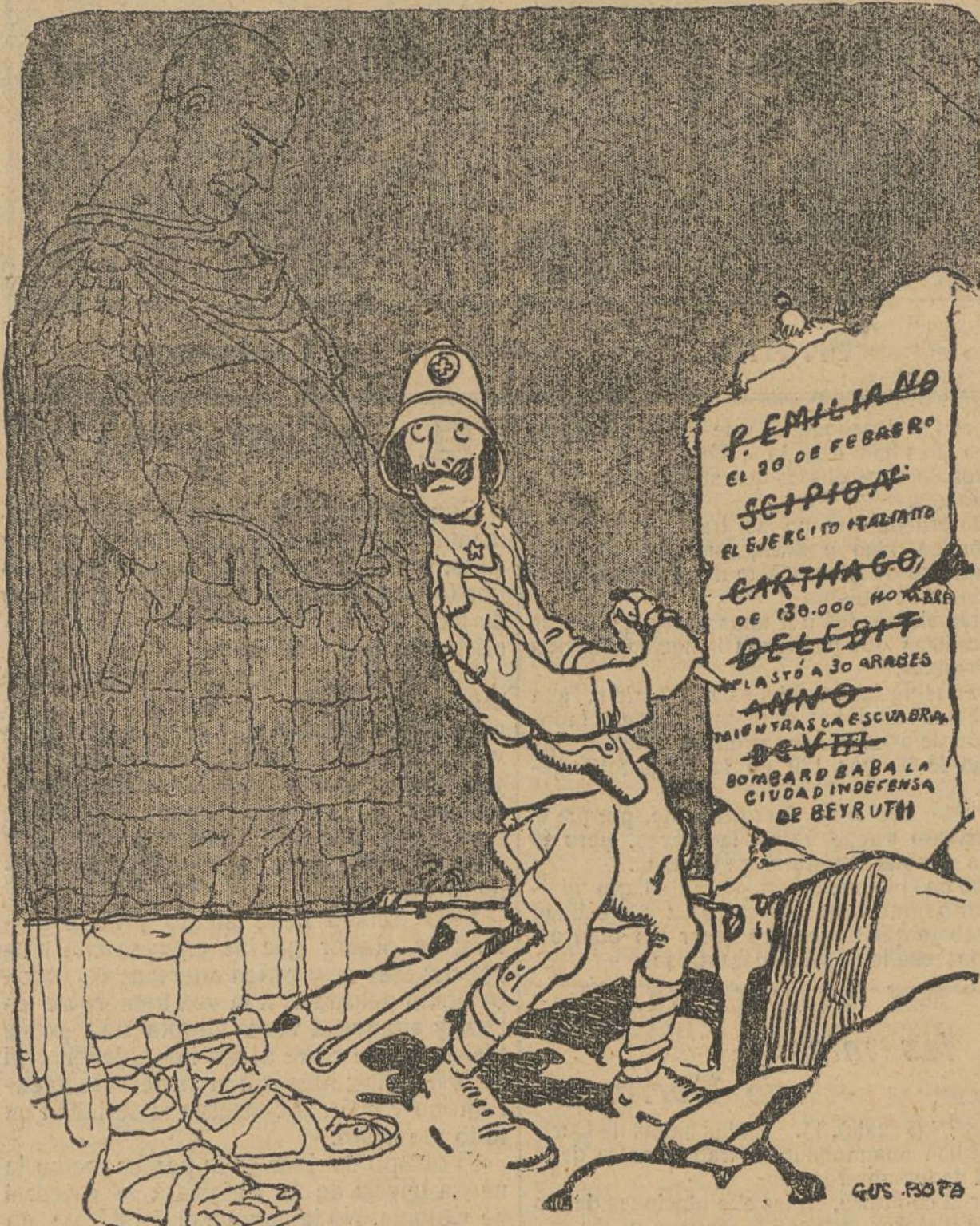
La sombra de Escipión.—Tartarin, exageras!

Los gloriosos hechos de nuestro ejército renuevan los de la Roma antigua. (Discurso pronunciado en el Parlamento italiano.)