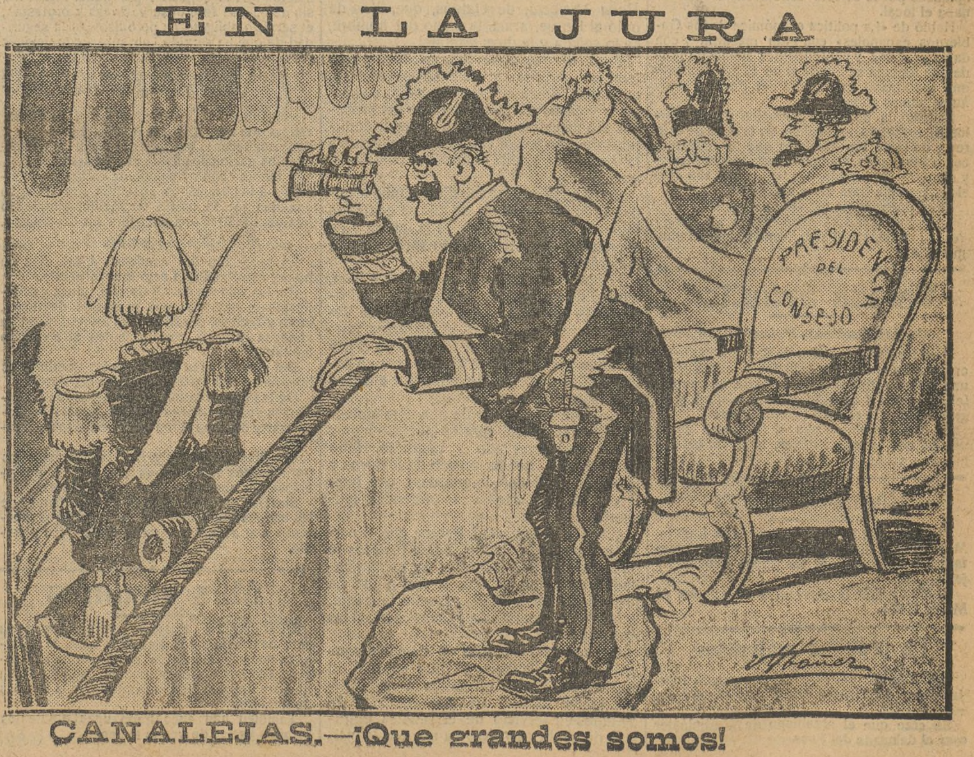
CANALEJAS.—¡Que grandes somos!

VENECIA, 24. Hoy, á mediodía, han llegado á esta capital, viajando de incognito, el Emperador Guillermo y personas de su familia que le acompañan.