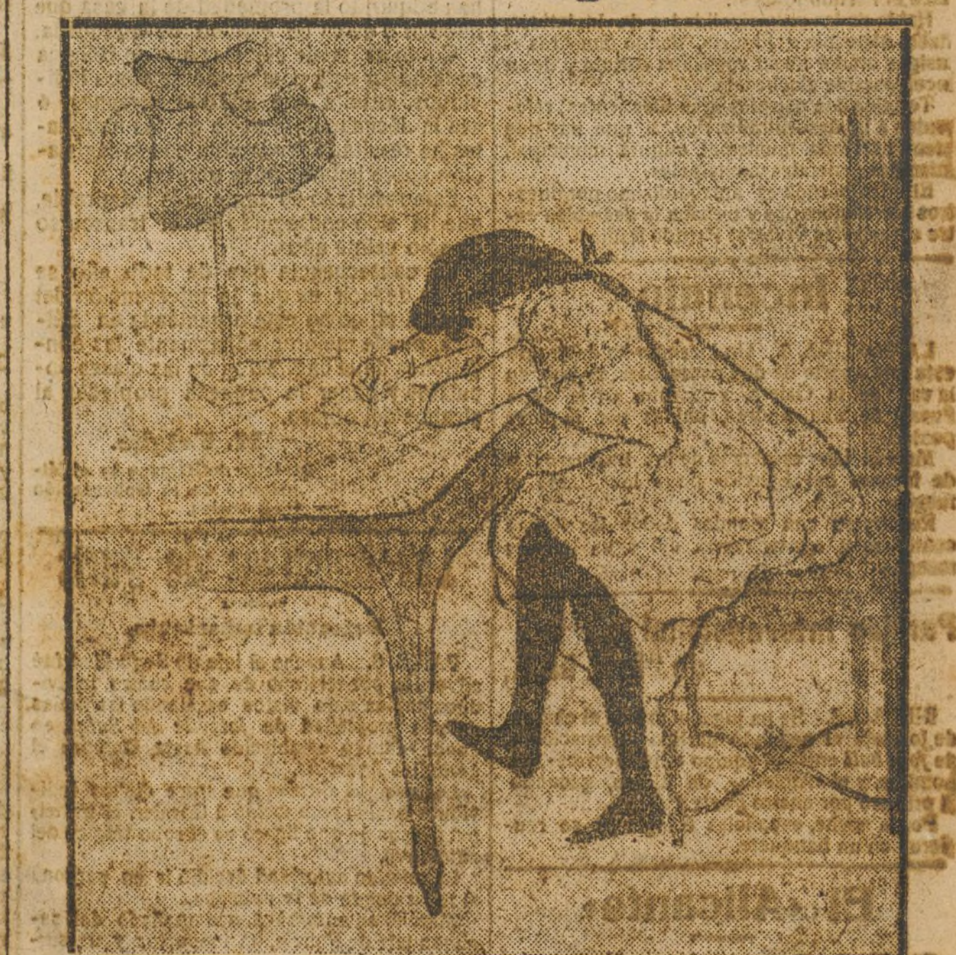
...Sobre todo, no me escribas esas cosas... mamá abre todas mis cartas.