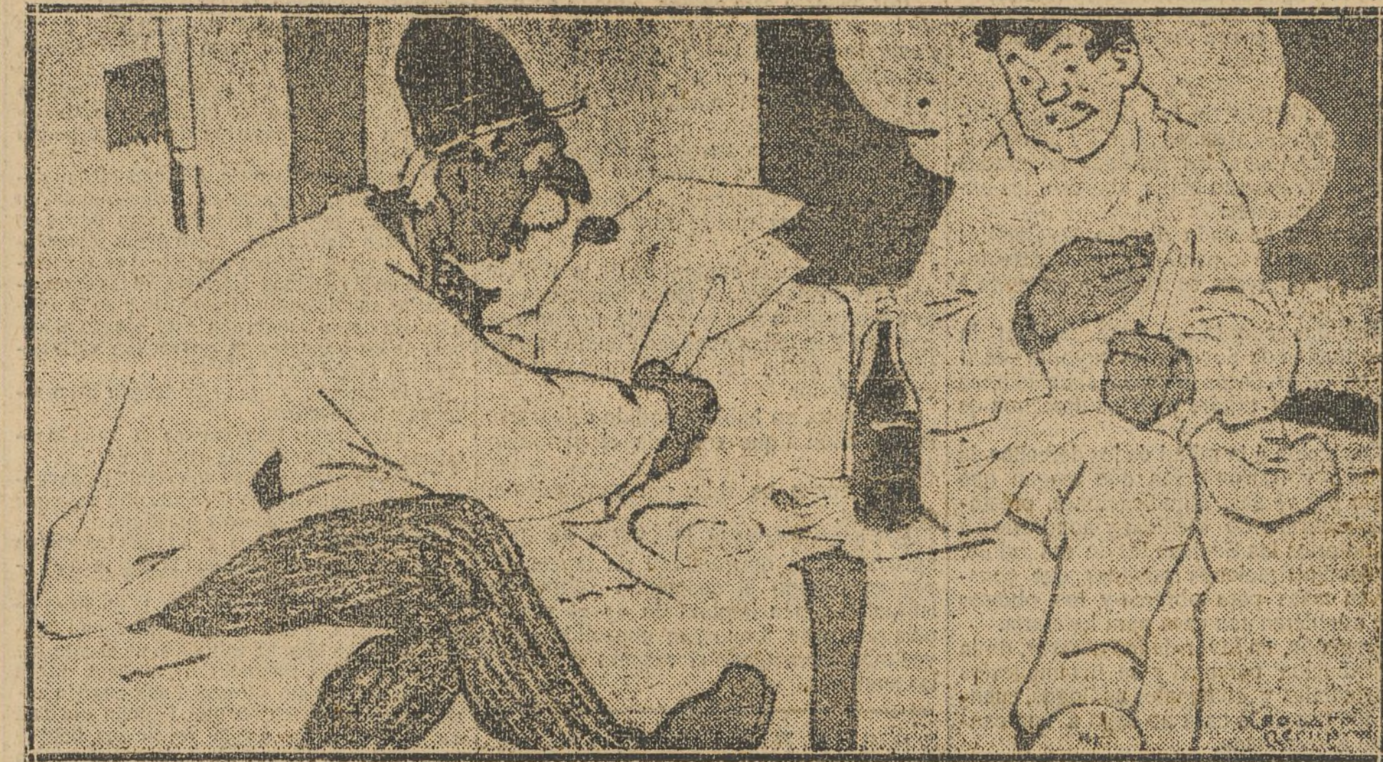
—¡Oye! La duquesa del Archipiélago recibirá a sus íntimos el sábado en lugar del martes.

Habiéndose salvado la sima citada la impresión del personal técnico es que si, como se espera no ocurrir incidentes, el encuentro de los obreros españoles con los franceses se efectuará a mediados del verano.