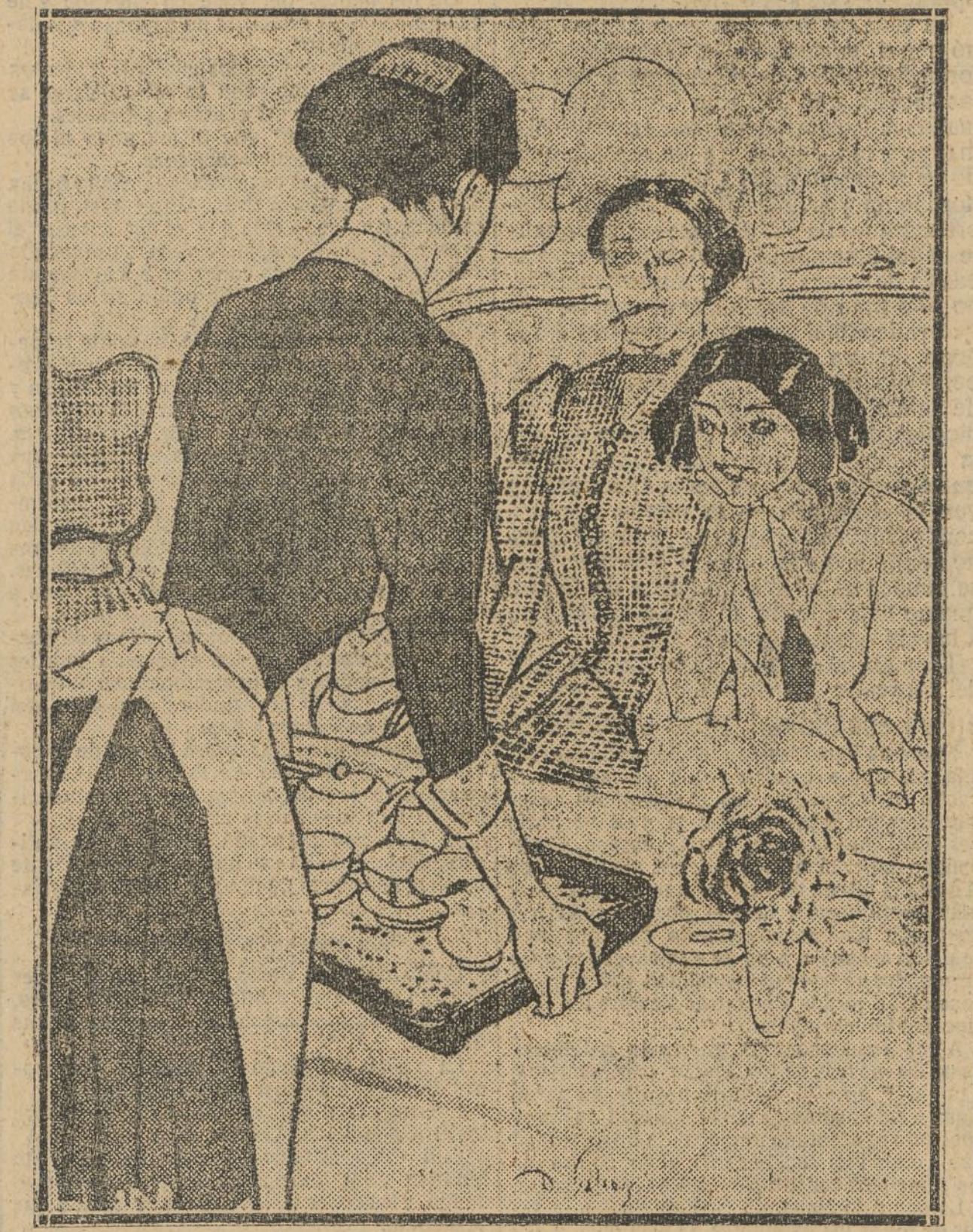
LA CAMARERA.—Un café para el señor y un chocolate para la señora. ¿Quién es el señor?