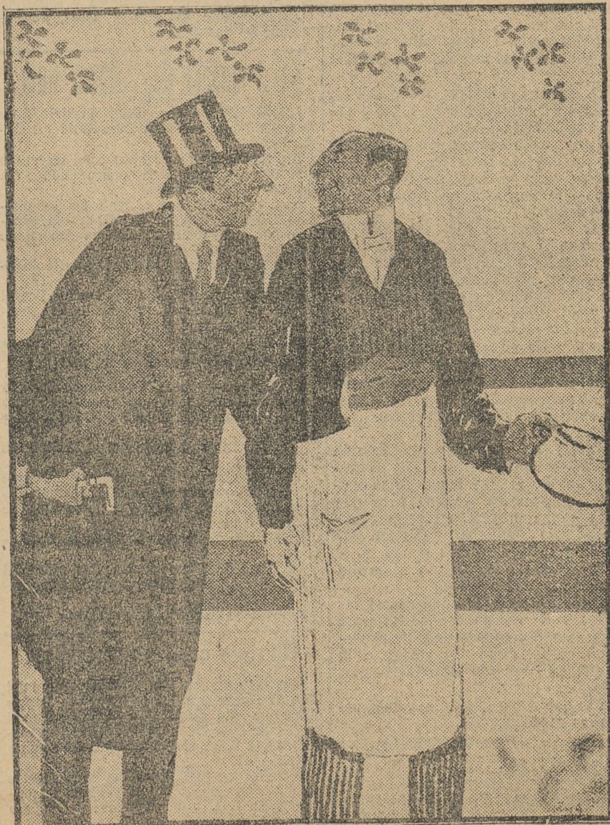
El «reporter» al ayuda de cámara.—«Eso es del señor ministro? Déjame examinarlo para ver si contiene algo interesante».

La República no triunfará en España si no se hace cada día un poco de revolución.