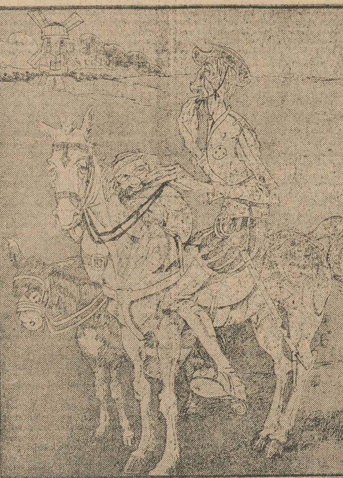
DON QUIJOTE.—Hace tres siglos que yo inicié los ataques contra los molinos de viento y aún están de pie. SANCHO.—Habrá que emplear medios más radicales.