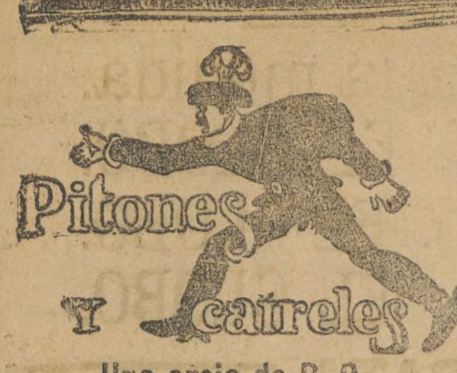
Una oreja de R. O.

...do. Se ha ...vivos a ...que se ...Tele- ...edición ...a al li- ...ento ha ...el buque ...as expe- ...tintas fa- ...ista con- ...entaban ...a noche ...del naufr- ...y su ...n en la ...uti, presa ...maufra- ...aras para ...dolor le ...palabras, ...ción por ...critaron ...s una- ...ente del ...ta sido ...50 votos ...la sesión ...pronun- ...manifes- ...a por la ...luto a ...mor ...en Berlín ...polaca, ...spismo ...ndez-vus ...e la fati- ...e el velo ...a), y me- ...teatro ha- ...des persi- ...nas des- ...es es- ...laca, pro- ...s sonri- ...os de her- ...de mar- ...das inte- ...siempre ...istas, pa- ...anny cu- ...de las mi- ...ante. La ...stituirse ...do hallar ...s temen- ...de un co- ...me enga- ...razo por ...Mientras ...una joga- ...nca, abal- ...s su cora- ...bre para ...n miles de ...es esclá- ...e mismo ...lla lleva- ...a los am- ...no indio- ...e de con- ...lotan en ...a sea las ...millares ...nuncia la ...influencia ...y toda la ...rectoras ...en por- ...del infame ...llo de man- ...y la se- ...presta- ...gallardía, ...a juzga y ...uto con ...el amante ...pasan la ...tud de ne- ...de su so- ...ra en sus ...erencia é ...cogen de ...en prote- ...en feli- ...derecho a ...por por ...guiza un ...mujer me- ...la pobre ...a que ha ...a admini- ...abismos ...rende un ...a toda la ...edad en ...ark. ...unfará ...e cada ...ción.