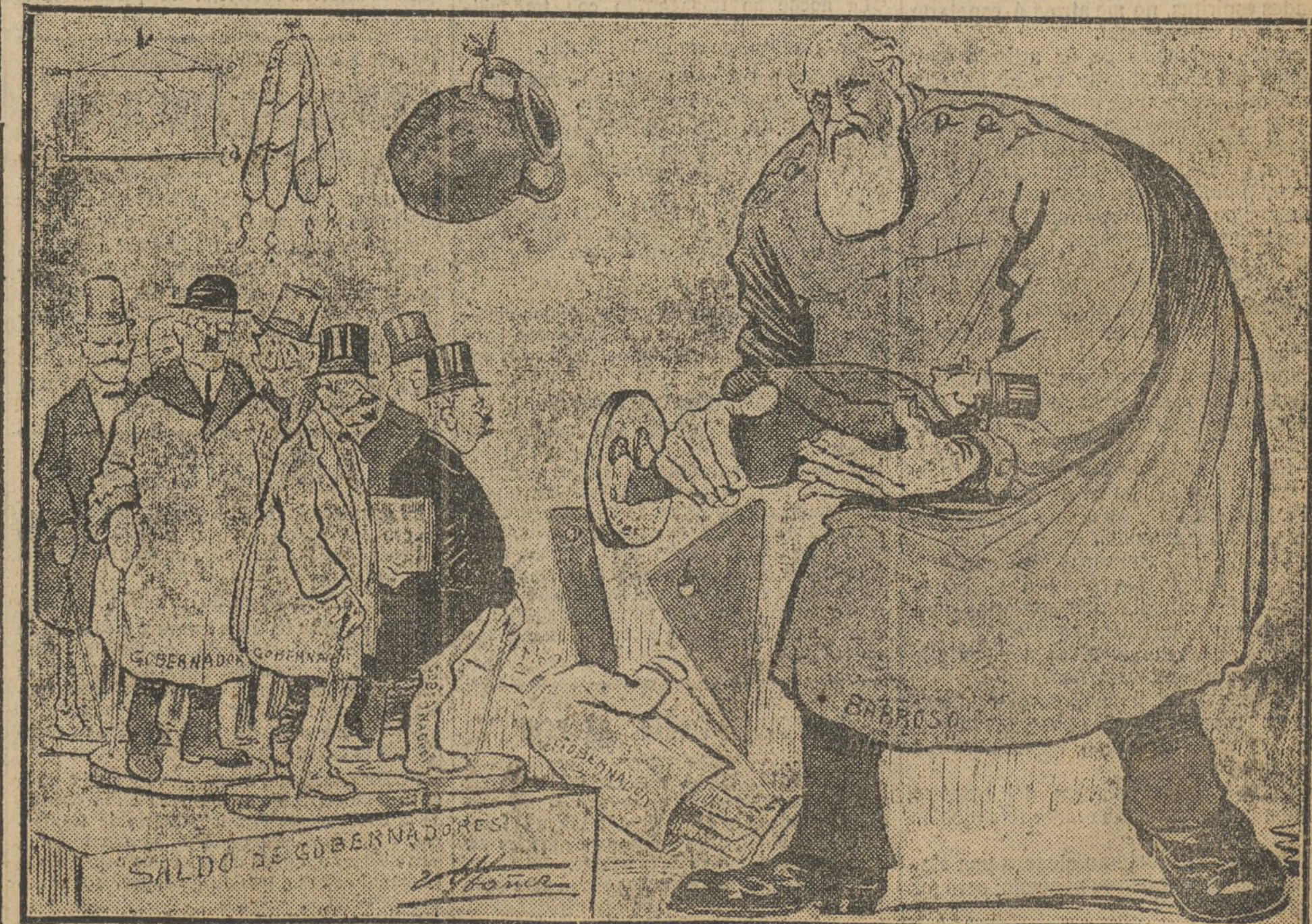
BARROSO.—Después de tanto tiempo, parece que me han salido bastante decentitos.