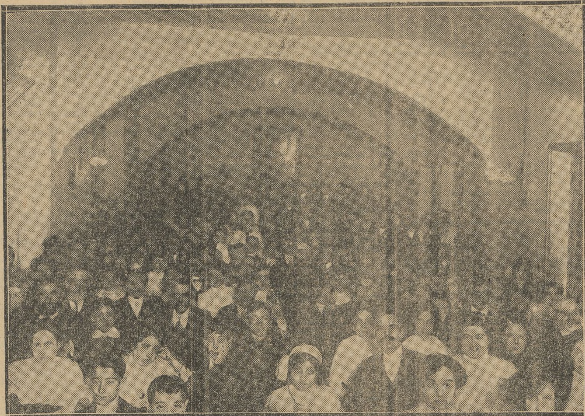
Aspecto de la sala en la velada teatral celebrada anoche.