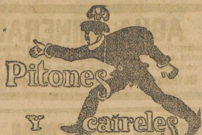
Las corridas de hoy

Las negociaciones. Leemos en El Imparcial: «Todavía hoy el jefe del ministro de Estado ninguna nueva noticia relacionada con la negociación franco-española. Parace que en la actualidad están al habla los Gobiernos francés e inglés acerca del asunto. Nos consta que Francia se niega de un modo formal a desistirse de sus pretensiones de que España le ceda todo el valle del Urga. El ministro de Estado se avenía a dividir el valle en dos partes: una para Francia y otra para España; pero el Gobierno francés se ha negado a este arreglo. Ante tal infranqueabilidad, el Gabinete de Madrid espera la solución que pueda ofrecer la intervención del Gobierno inglés.