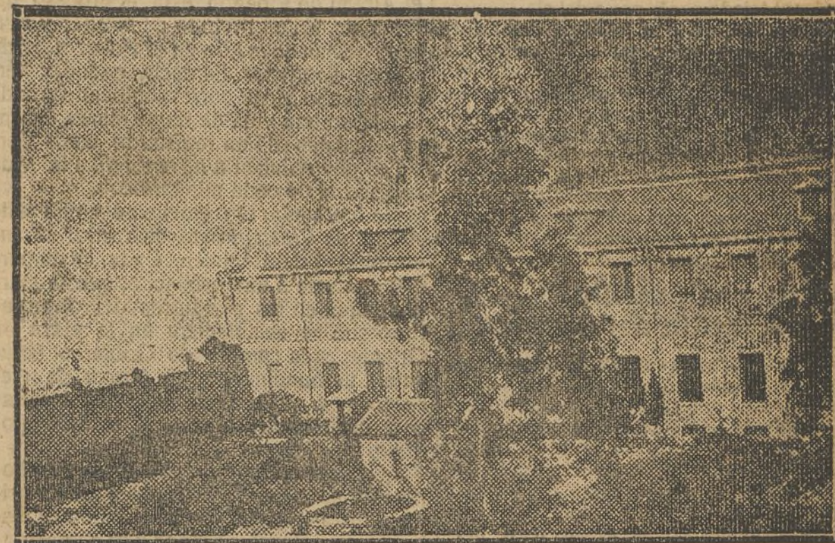
Vista interior del convento tomada desde el jardín.