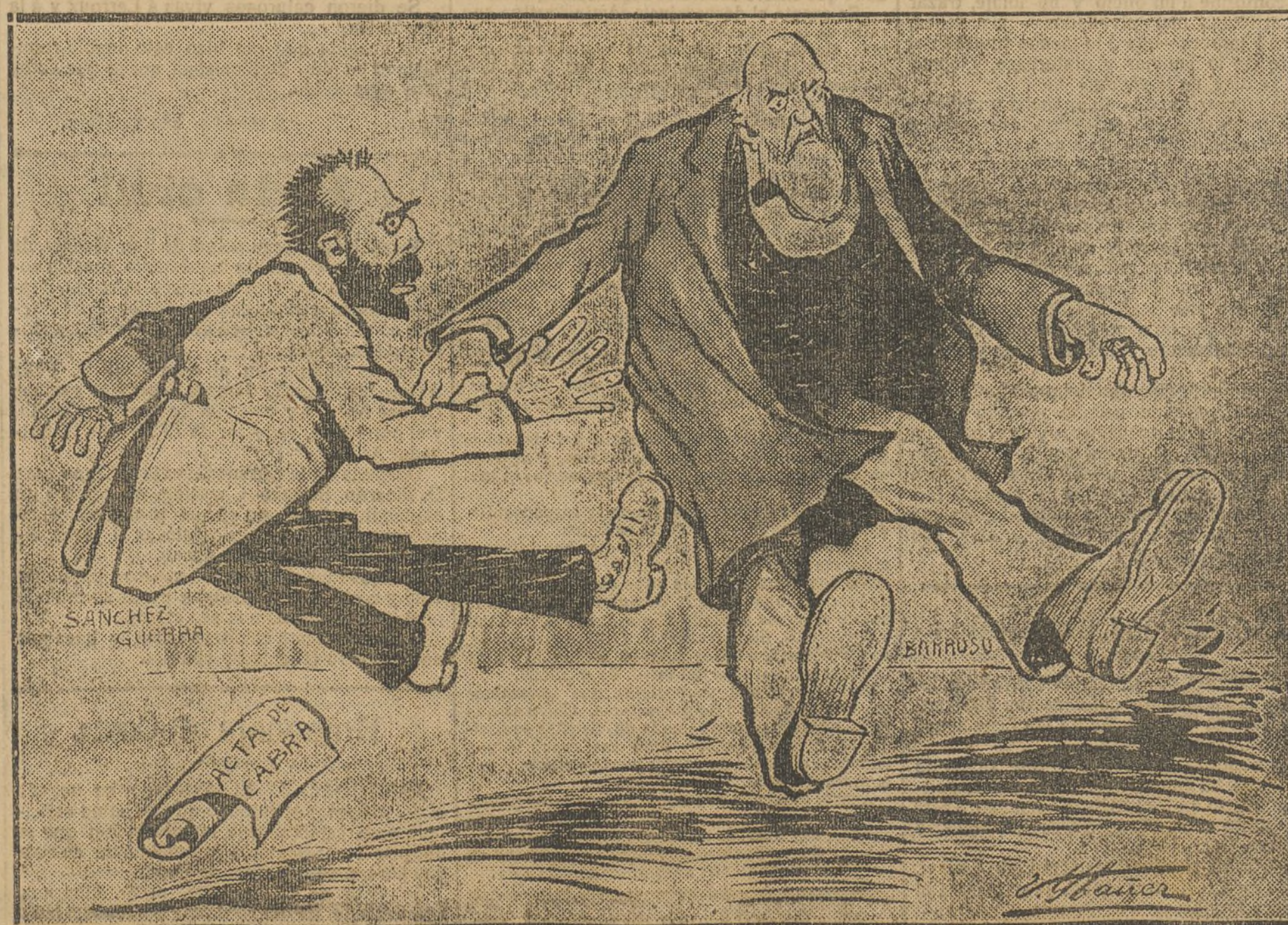
SANCHEZ A BARROSO.—¡La verdad es que debían nombrarnos hijos adoptivos de Cabra!