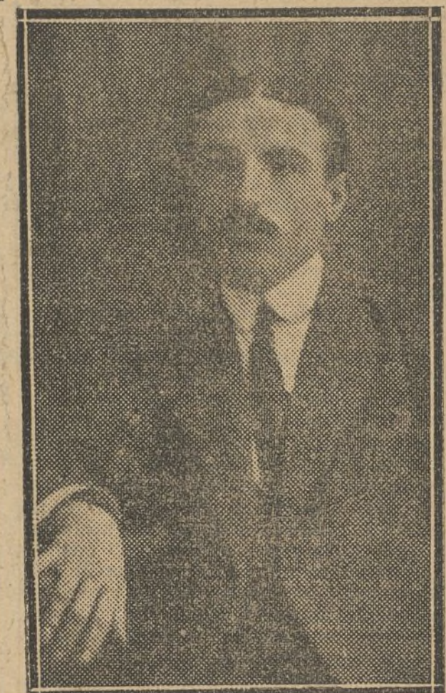
MARIANO LILLO Presidente de la Juventud Radical

Los socios tendrán los mismos derechos, aunque posean varias acciones; pero las ventajas que les proporcione el Montepío estarán en relación con el número de acciones que posean.