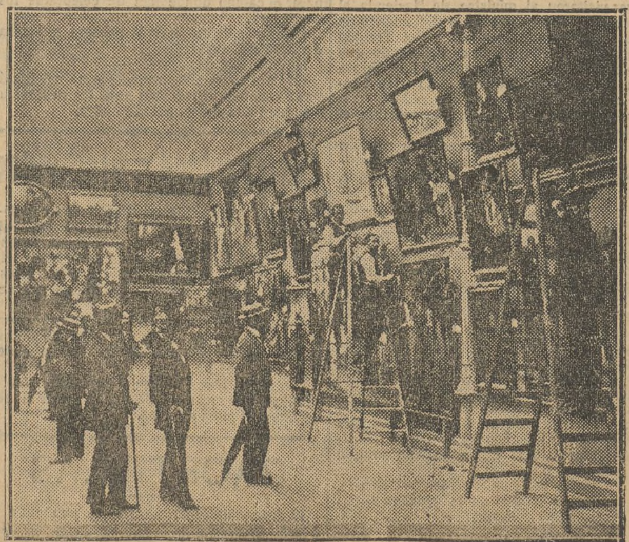
El barnizado en la Exposición.

Otros grupos han tiroteado batallón que ocupaba altura que dominan desfiladero de Trevia, saliendo en su apoyo general Molto desde izahen, que hizo huir á los moros.