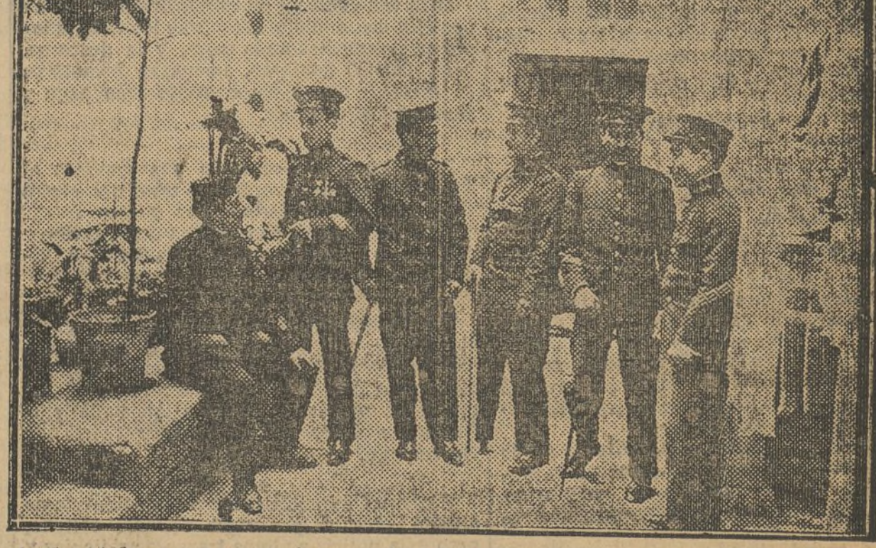
ta el año 1888, en que se pensó convertir el cuartel en panteón de hombres ilustres.