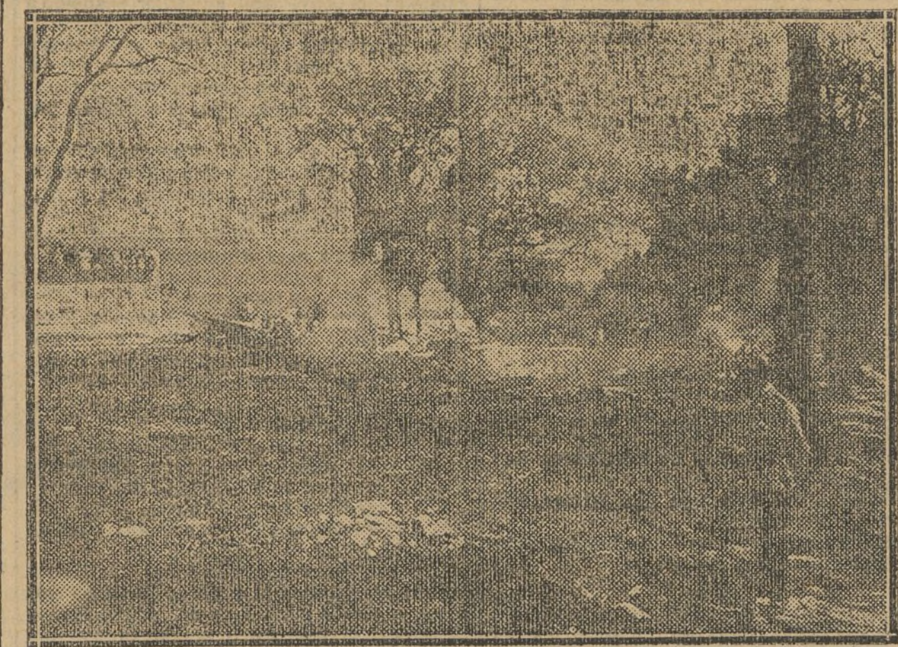
Lugar del siniestro y restos del edificio. No han ocurrido desgracias personales.