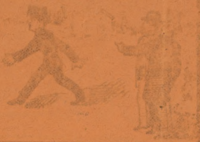
Ama y novio a la doncella saben chistosa que ella