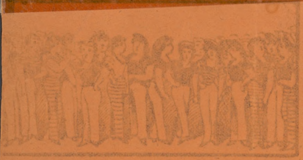
Coro de marineras muy graciosa y bonita