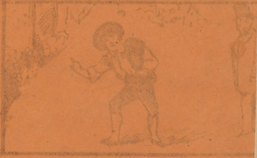
meo hego un forastero que gracia es latero