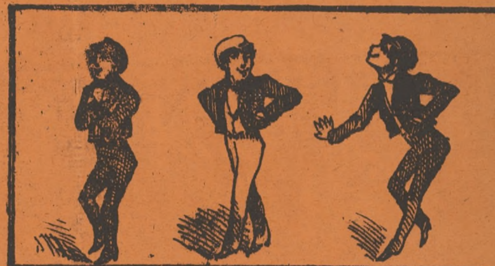
Por si váis con bravatas, agui teneis á los Ratas.