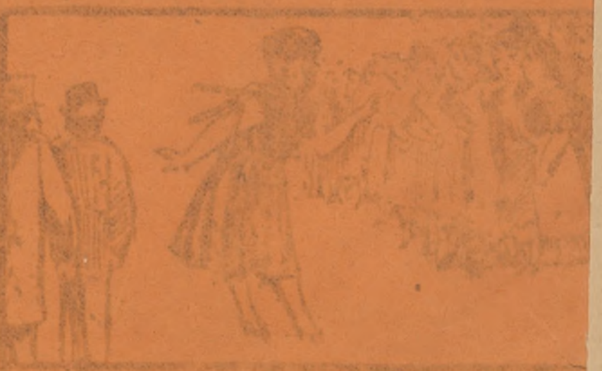
muja con plantetas sacan las coxiteras