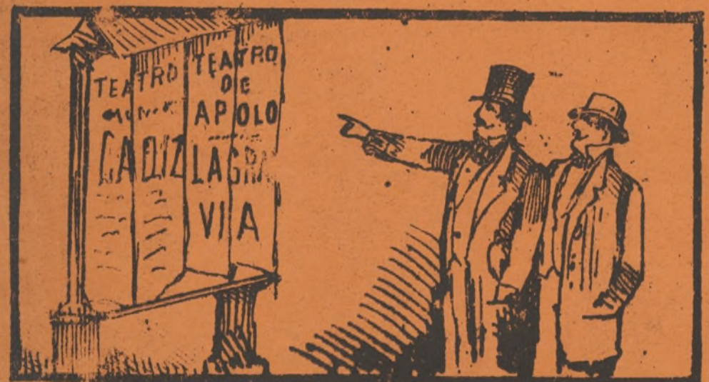
Para divertirse hoy dia, CADIZ, ó á la GRAN VIA.