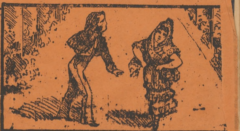
La Lidia no vé el toreo, y Jindama, dice, lo creo.