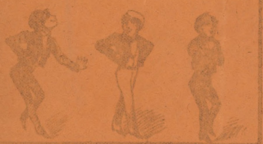
Por si vais con travestis apuntados a los platos