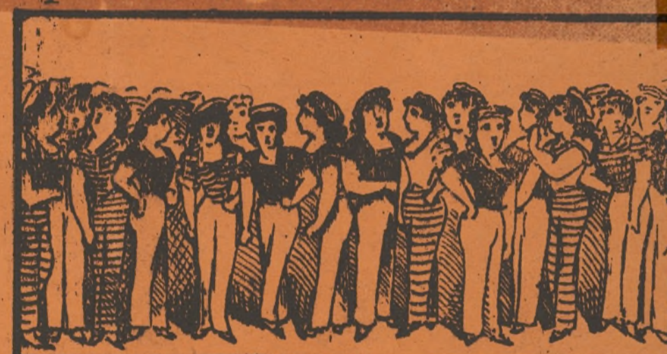
Coro de marineritas, muy graciosas y bonitas.