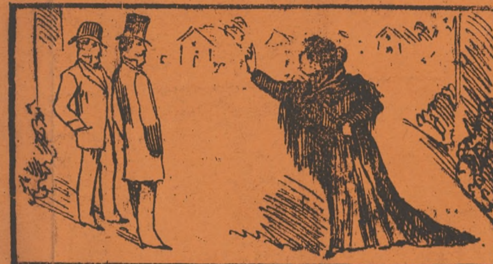
Y las injurias, despues, le pone como tu, ves.