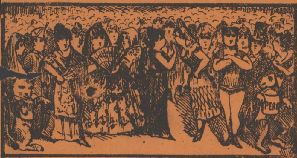
Las Calles van de rondon, á tratar de la cuestion.