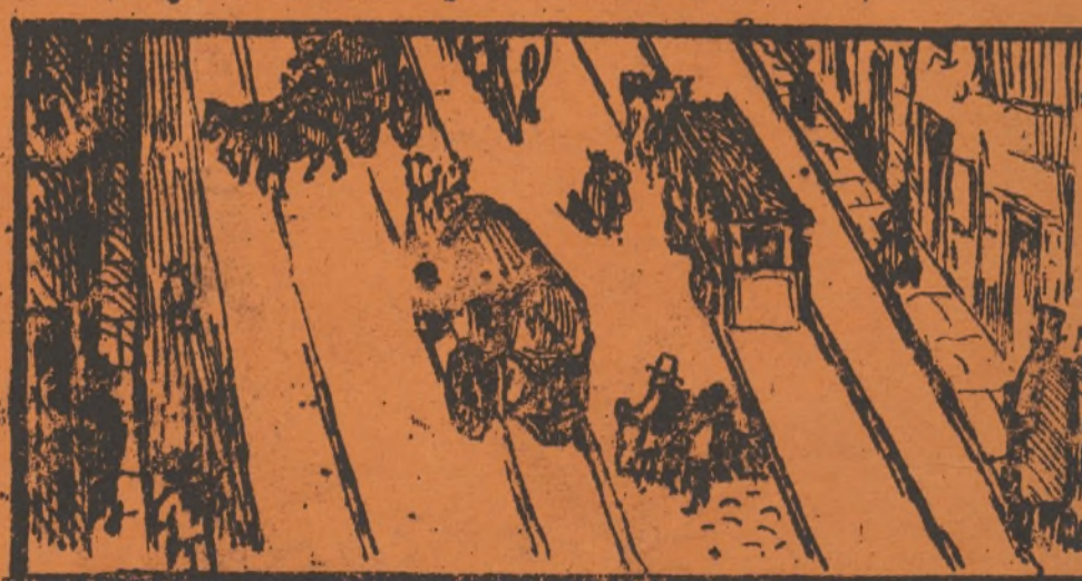
La Municipalidad, hace ver la realidad.