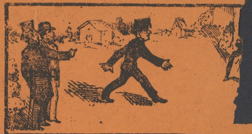
Ama y novio á la doncella, arman chistosa querella.