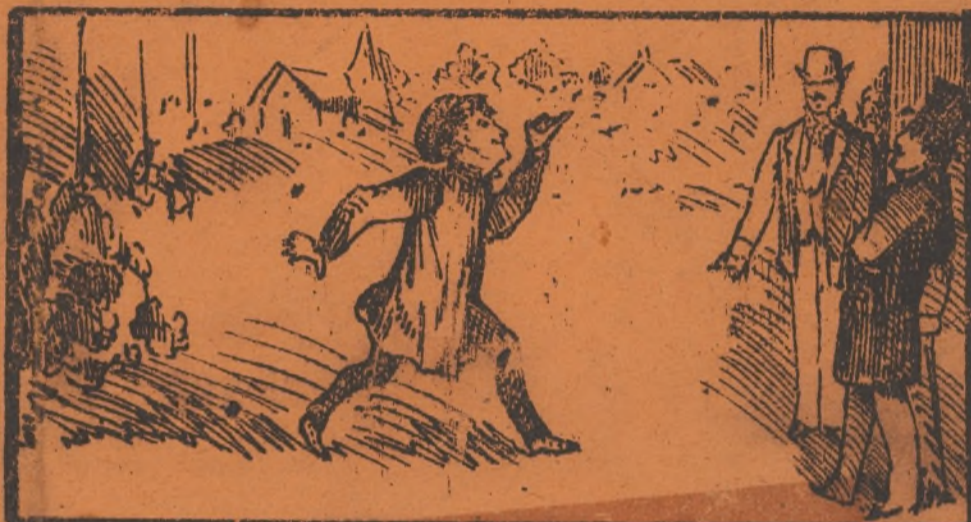
Pacificamente hablando, este siempre, está matando.