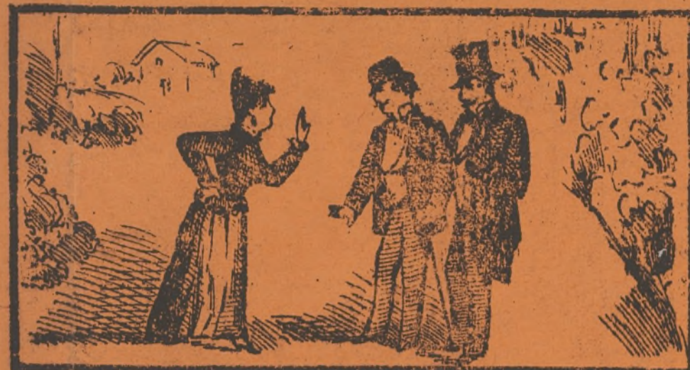
Esta viene á decir, pobre chica, la que tiene que servir.