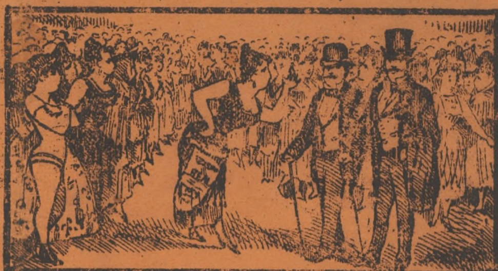
Quando llega un caballero, que de gracia es el primero.