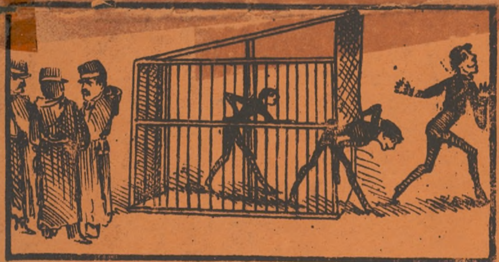
Cantando con gran salero, yo soy el Rata primero.