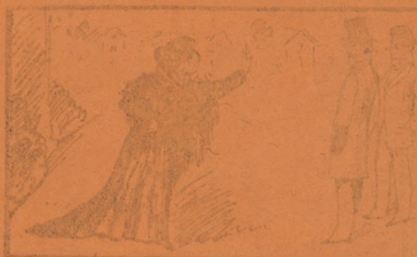
as injurias, despues me como tu ves