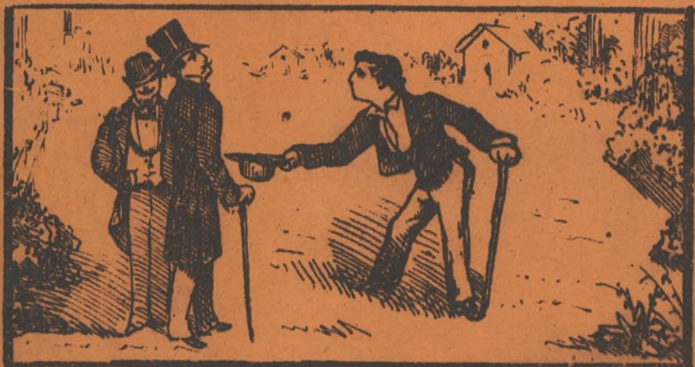
El barrio „Prosperidad“ de la necesidad.