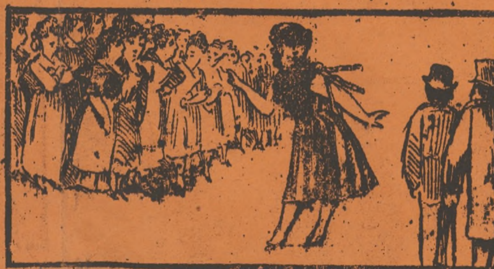
Contempla cuan plabenteras, agui estan las Cocineras