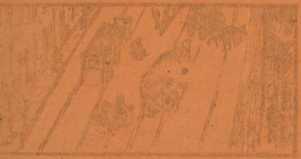
La Murciyabilidad hace ver la realidad