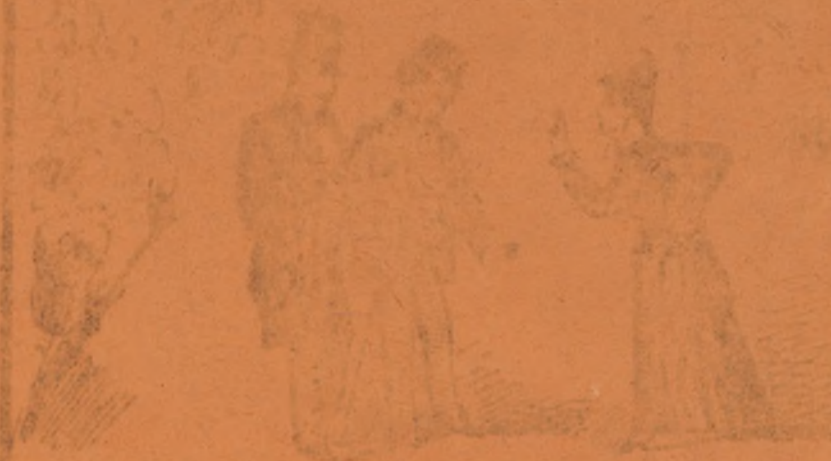
tiene a decir cerca la que tiene que servir