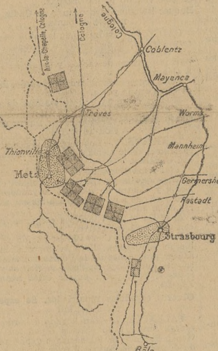
Una hipótesis de concentración alemana en 1913

Por considerarlo muy interesante, transcribimos, traduciéndolos, varios párrafos del libro «La guerra contra l'Allemagne», estudio estratégico lleno de interés, con croquis muy curiosos referentes a la concentración de los ejércitos francés y alemán, y a las hipótesis posibles en el caso de que los alemanes hicieran el mayor esfuerzo contra el ala izquierda francesa, es decir, a través de Bélgica.