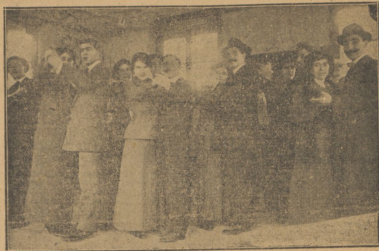
BAILE EN UN MERENDERO

El «reporter» es como los caracoles: le gusta tomar el sol cuando el sol se deja tomar, que es pocas veces, en invierno. Pero como da la casualidad que los paseos, plazas, calles y afueras que tiene Madrid están en tan lamentable estado que sólo con zancos y con escafandra se pueden atravesar en invierno, pues ¡vaya! lector amable, por qué el «reporter» se va lejos, en busca de otro término municipal, para poder disfrutar de la estufa planetaria, que es la más económica.