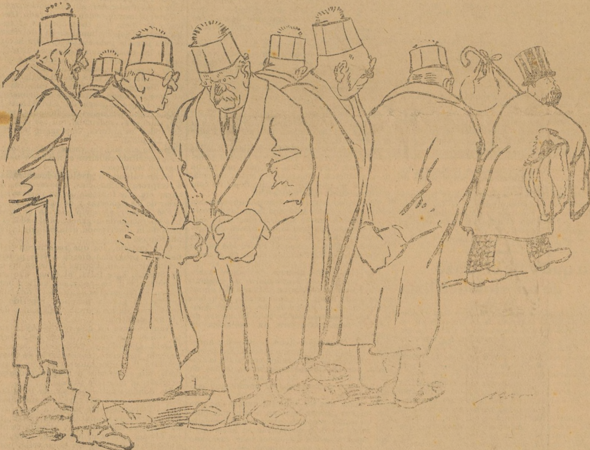
LOS DE LA TOGA.—Con esta partida no habíamos contado.

para el negociado de las bárbaras torturas. Una delación lleva á la hoguera, tocados de la infamante coraza, á los ciudadanos inocentes. No se respira, no se vive. Ante la Inquisición, chitón. Los más audaces vierten en los recovecos del léxico las sátiras triviales, y aun así, la prisión es perenne amenaza. La revolución tuvo que ser inminente, según nuestro vulgo. A la persecución debió responder la rebeldía. ¡Sí, sí! España, rebaño de mansas ovejas, soportó la tiranía del Poder.