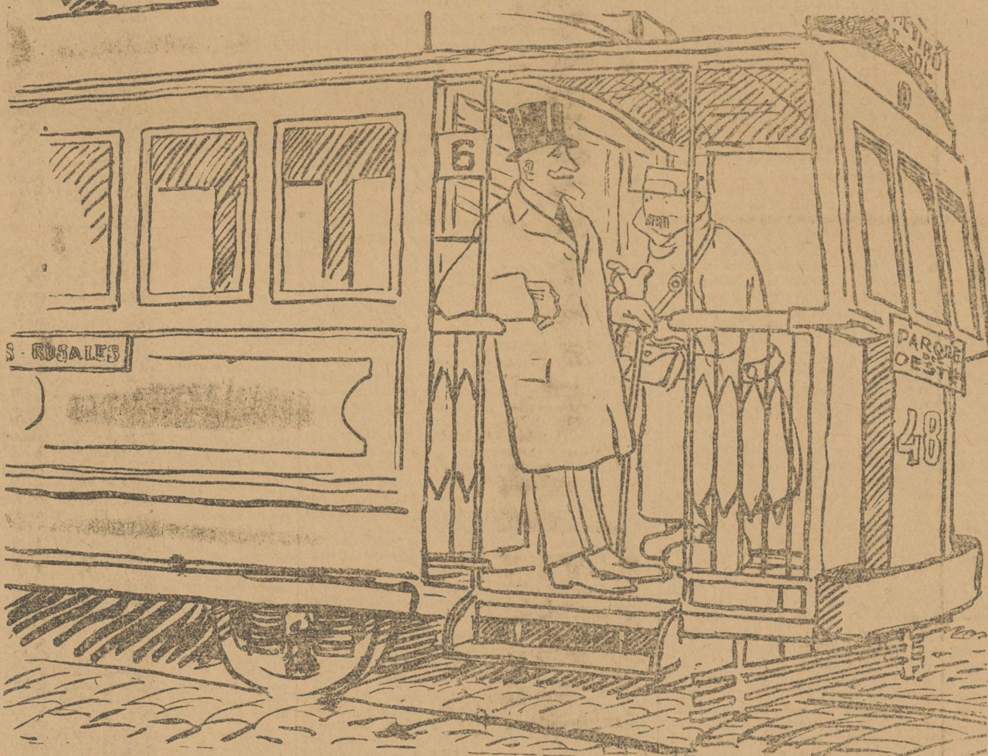
EL COBRADOR. ¿Dónde va el caballero? MAURA. Al Retiro; pero deme billete de ida y vuelta.

que al servicio de su programa pone una voluntad indoblegable. Le basta querer para afirmarse en el alto puesto que hoy ocupa. Pero si á las promesas suceden las vacilaciones inconfesables, el desvío de la opinión será peor adversario que la hostilidad de los conservadores.