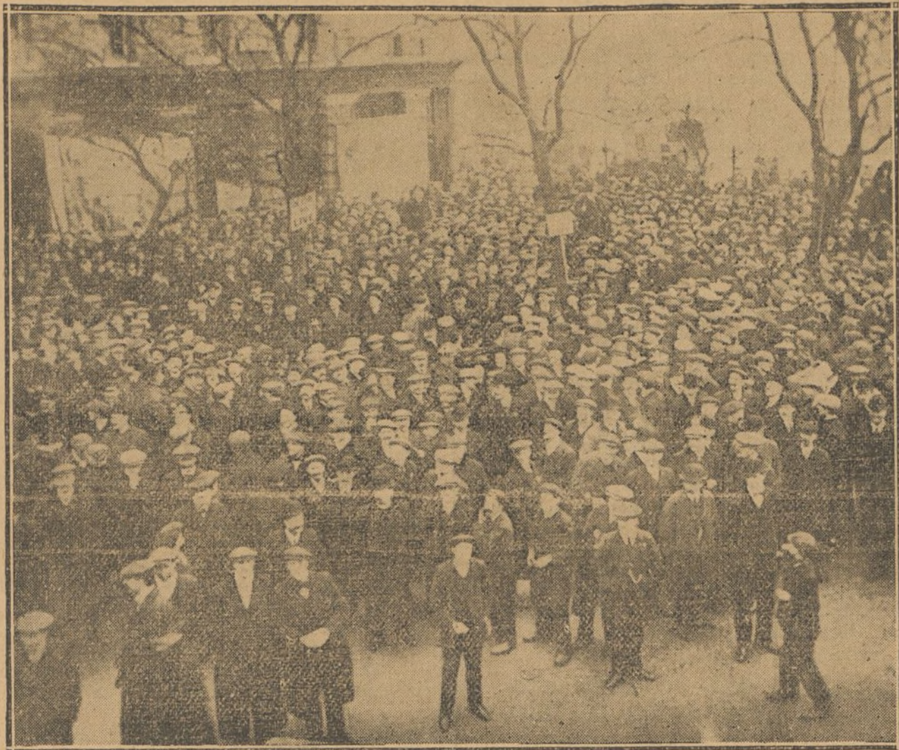
MANIFESTACION DE HUELGUISTAS FRENTE AL MINISTERIO DEL TRABAJO