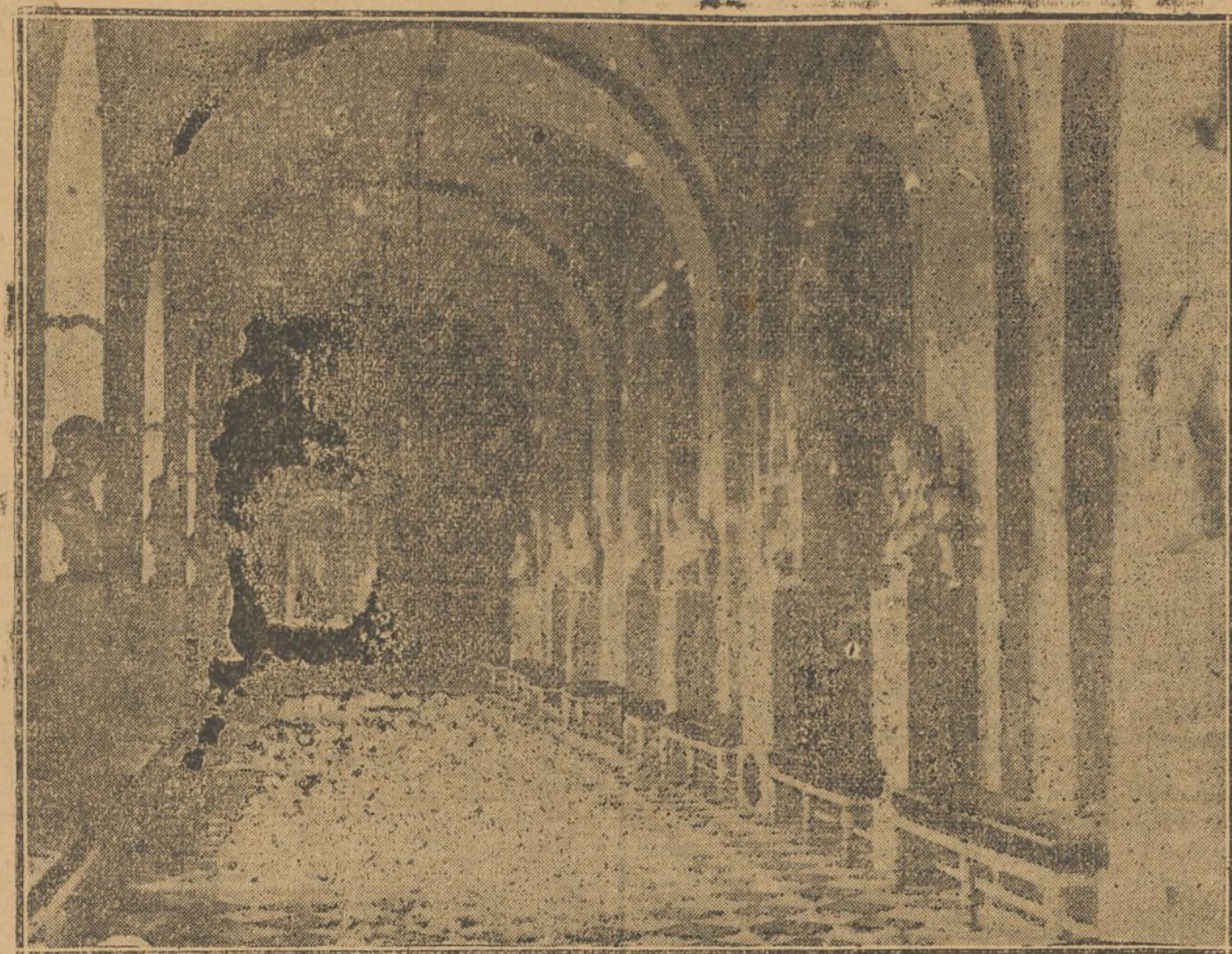
SALA DE LOS PASOS PERDIDOS, EN EL PALACIO DE VERSAILLES, RESERVADA A LOS MIEMBROS DEL CONGRESO PARA LA JORNADA HISTORICA DE ELECCION DE PRESIDENTE DE LA REPUBLICA, QUE SE CELEBRARA HOY EN DICHA CIUDAD FRANCESA. ESTA GALERIA ESTA ADORNADA CON LOS BUSTOS DE LOS GRANDES HOMBRES DE FRANCIA

El Sr. Villar conoce lo que se practica en el extranjero, tiene su criterio, que sencillamente expone, y aboga por una enseñanza mu-